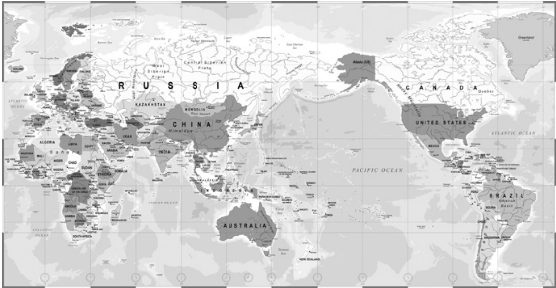
Abb. 2 China-zentrierte Weltkarte

zwangsläufig auch <technisch> sind. Bilder können aber auch anhand ihrer Bezeichnungsfunktionen unterschieden werden: So gibt es im Feld der Diskussion der technischen Bilder auch die Unterscheidung indexikalische/nicht-indexikalische Bilder , eine aus der Semiotik von Charles Sanders Peirce hergeleitete Differenz, die beschreibt, ob Bilder kausal mit dem Abgebildeten verbunden sind (wie z. B. in der Fotografie) oder nicht (wie in der Malerei). Eine andere Differenzierung hinsichtlich der Bezeichnungsfunktion ist jene in singuläre und generelle Bilder , also bezüglich der Frage, ob ein Bild eine konkrete Entität oder eine allgemeine Klasse von Entitäten darstellt – z. B. Bilder in einem Lexikon zu einem Artikel über eine Klasse von Entitäten. Aber auch in der Werbung werden Bilder oft generell genutzt, so stellt z. B. ein Mann in einer Autowerbung in der Regel nicht diesen Mann, sondern Männer allgemein dar. Überdies soll hier noch die Unterscheidung in fiktionale und nicht-fiktionale Bilder genannt werden, aber es gibt noch viele weitere. 15