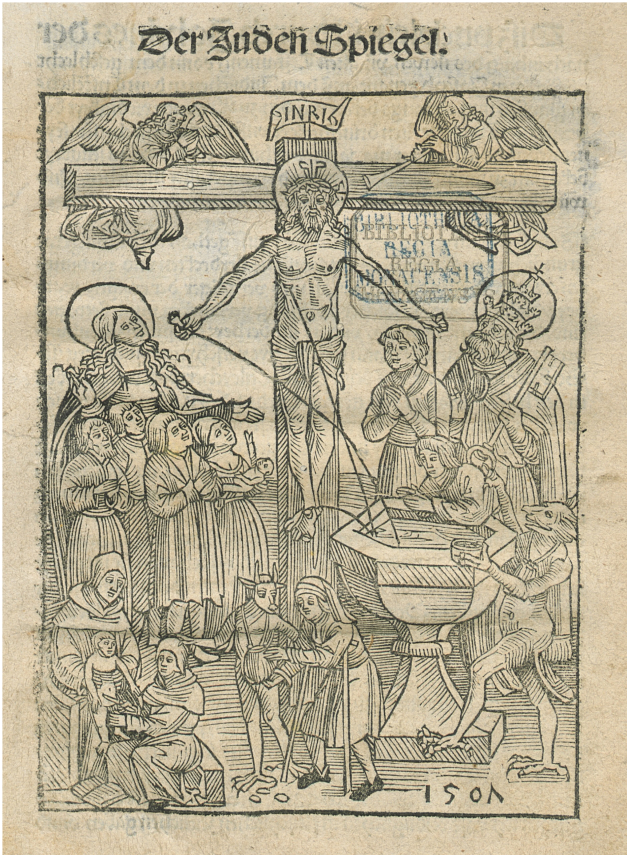
Abb. 1: Johannes Pfefferkorn: Der Juden Spiegel, [Nürnberg: Huber] 1507; VD16 P 2300, Titelblatt.