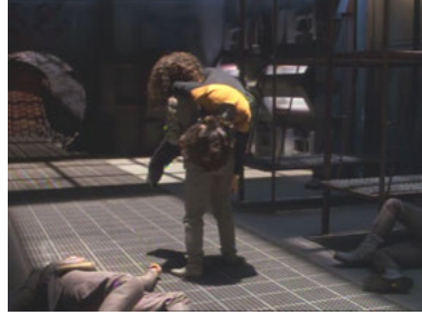
VOY 1x14 Von Angesicht zu Angesicht