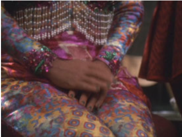
DS9 6x23 Die Beraterin