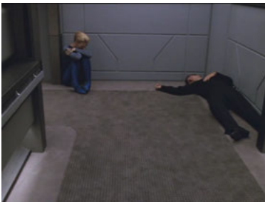
VOY 5x07 Das Vinculum