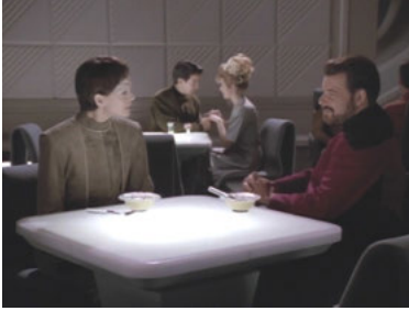
TNG 5x17 Verbotene Liebe