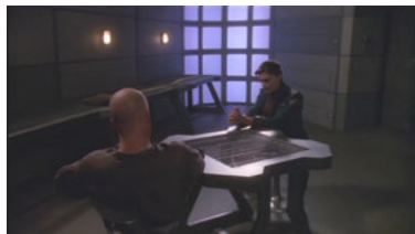
B5 5x06 Der Herr der Bluthunde