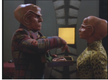
DS9 2x07 Profit oder Partner!