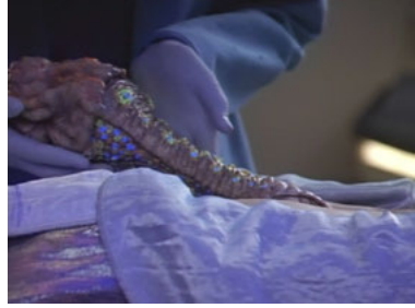
TNG 4x23 Odan, der Sonderbotschafter