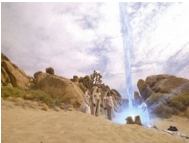
DS9 7x02 Schatten und Symbole