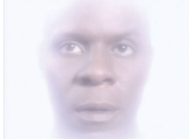
Abb. 58: Sisko bei den Propheten