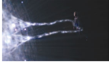
B5 4x02 Der letzte des Kha'ri