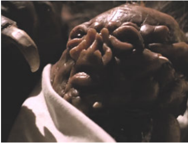
AND 1x18 Die Schlange im Paradies