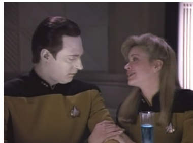
TNG 4x25 Datas erste Liebe