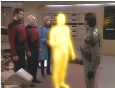
TNG 3x25 Wer ist John?