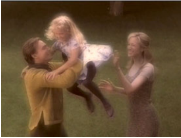
VOY 4x01 Skorpion II