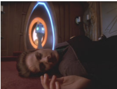
DS9 6x26 Die Tränen der Propheten