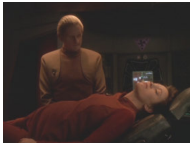
DS9 5x11 Dunkelheit und Licht