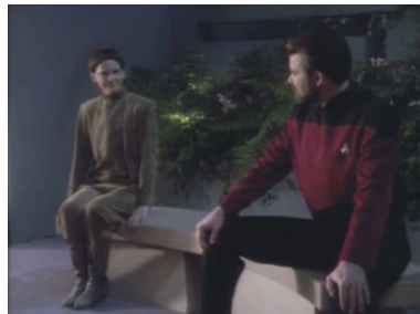
TNG 5x17 Verbotene Liebe