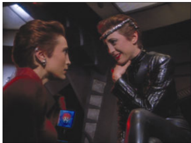
DS9 2x23 Die andere Seite