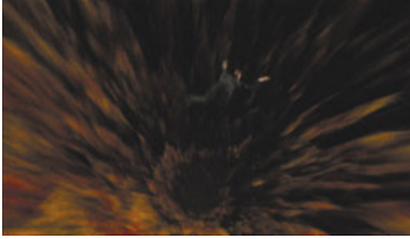
B5 4x01 In der Stunde des Wolfs