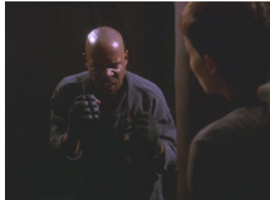
DS9 5x13 Für die Uniform