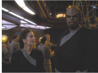
DS9 6x26 Die Tränen der Propheten