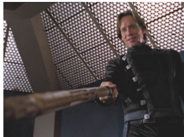
AND 1x01 Die lange Nacht