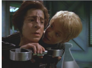
VOY 3x10 Der Kriegsherr