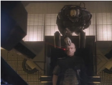
TNG 4x01 Angriffsziel Erde