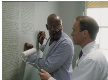
DS9 7x02 Schatten und Symbole