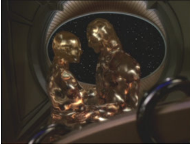
DS9 6x04 Hinter der Linie