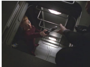
VOY 5x22 Liebe inmitten der Sterne