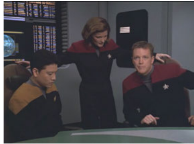
VOY 5x15 Das ungewisse Dunkel I