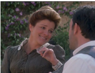
VOY 6x11 Fair Haven