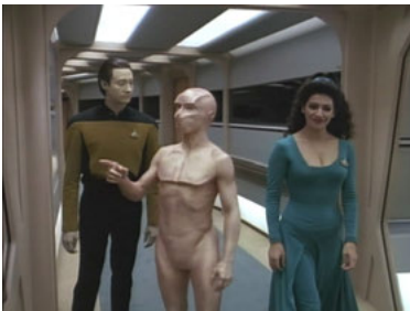
TNG 3x16 Datas Nachkomme