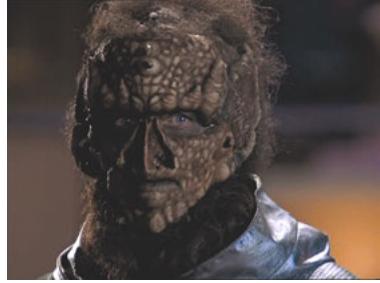
AND 1x07 Philosophie des Todes