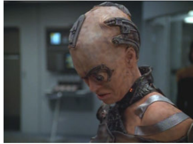
VOY 5x02 Die Gabe