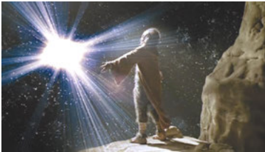
AND 3x15 What happens to a Rev Deferred?