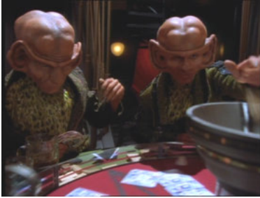
DS9 2x07 Profit oder Partner!