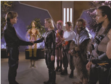
AND 1x01 Die lange Nacht