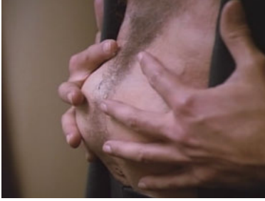
TNG 4x23 Odan, der Sonderbotschafter