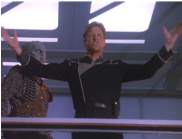
B5 4x03 Rückkehr vom Schattenplaneten