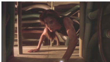
B5 5x10 Die letzte Gefangene