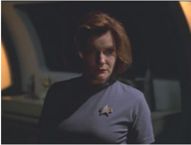
VOY 5x01 Nacht