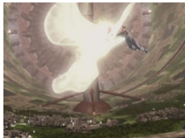
B5 2x22 Ein Pakt mit dem Teufel