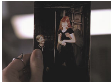
AND 1x21 Die Odyssee