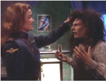
B5 2x08 Drei Frauen für Mollari