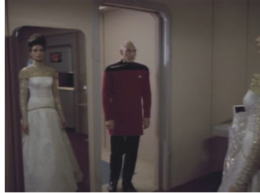
TNG 5x21 Eine hoffnungslose Romanze