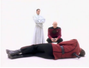
TNG 6x15 Willkommen im Leben nach dem Tode