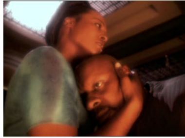
DS9 7x18 Bis dass der Tod uns scheidet