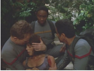
VOY 3x16 Pon Farr