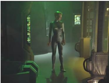
VOY 5x02 Die Gabe