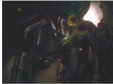
VOY 4x01 Skorpion II