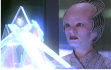
B5 1x22 Chrysalis