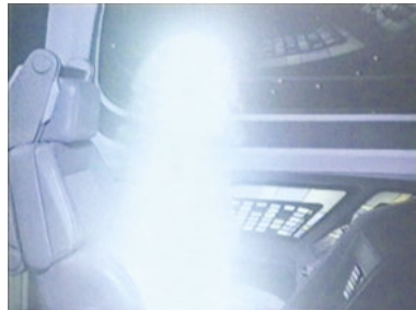
VOY 4x02 Die Gabe