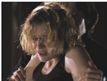
AND 1x21 Die Odyssee