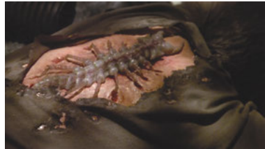
B5 3x07 Der Hüter des Wissens