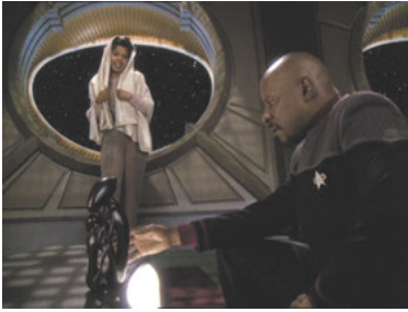
DS9 7x18 Bis dass der Tod uns scheidet