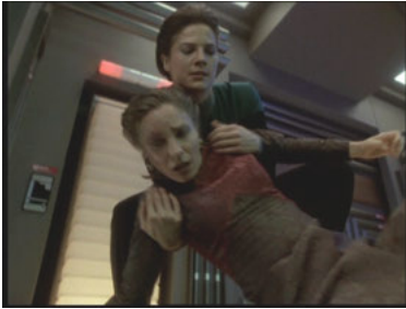
DS9 4x06 Wiedervereinigt