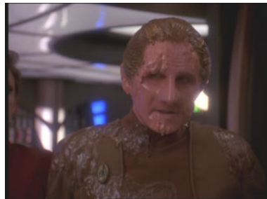
DS9 4x26 Das Urteil