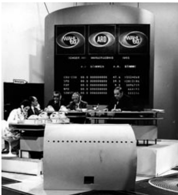
Abb. 6–7: Wahlsendung zur Bundestagswahl 1969 © WDR

Außerdem realisierte die ARD 1972 und 1976 Wahlempfangs, die in die Wahlabendsendungen integriert wurden. 24 Sie waren das Ergebnis der Diskussion diverser Vorschläge, die wegen der Quoten-Erfolge der ZDF-Wahlberichte und der Befürchtung »Massenzuschauer, mit deren Informations- und Unterhaltungsbedürfnis« 25 zu überfordern, vorgebracht wurden. Ein »Nummernprogramm« bestehend aus Auftritten verschiedener Stars hatte die Mehrheit der Chefredakteure Fernsehen vor der Bundestagswahl 1972 mit der Begründung abgelehnt, es müsse ein Kontrastprogramm zum ZDF ausgestrahlt werden. Auf Empfehlung der Ständigen Programmkonferenz