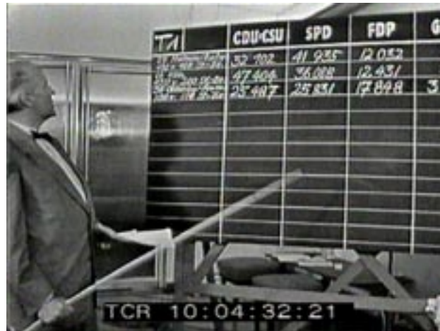
Abb. 1–2: Einfache Visualisierung der Wahlergebnisse

Charakteristisch ist zudem die insgesamt einfache ästhetische Gestaltung. Beispielsweise wurden Wahlergebnisse veranschaulicht, indem sie mit Kreide an eine Tafel geschrieben wurden. Weiterhin waren diverse Schaubilder auf Plakaten an Stellwänden angebracht; der überwiegende Teil hatte die Gestalt von Kreis- oder Säulendiagrammen. Darüber hinaus gab es Darstellungen, die in den Jahren danach in den Wahlabendsendungen nicht mehr zu finden waren. Dazu gehörte beispielsweise ein Regal, in dem Fotos von Köpfen der Wahlkreiskandidaten standen. Das Regal war zweigeteilt. Die linke Seite war die »unsichere«, die rechte die »sichere«, wie Moderator Kurt Mauch am 17. September 1961 in der ARD-Wahlabendsendung erläuterte: Die Fotos der direkt gewählten Wahlkreiskandidaten wurden dementsprechend von links nach rechts gestellt. Möglich war diese variationsreiche Darstellung durch die Einfachheit der damals eingesetzten Kommunikationsmittel. Mit dieser geht offenbar auch die starke Verwendung der Darstellungsform »Grafikinterpretation« in diesem Jahr einher: Sie machten beim Vorkommen 39 Prozent an allen Stilformen und hinsichtlich des zeitlichen Umfangs 34 Prozent der Gesamtsendezeit aus.