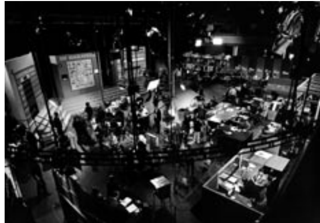
Abb. 4–5: Wahlsendung der ARD zur Bundestagswahl 1965

Etablierung professioneller Ergebnis- und Analyseübermittlung – abgeschwächte Kontrastierung zwischen ARD und ZDF