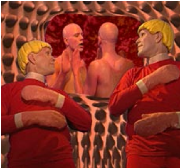
Szene aus »No Sunshine«