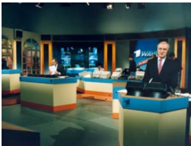
Abb. 9–10: Wahlsendung 1990

Charakteristisch sind in dieser Phase die Positionierungsversuche der Sender – insbesondere bei den Sendekonzepten. Die ARD besann sich 1987 auf die Informationsorientierung der 1960er Jahre, integrierte aber weiterhin Sport in ihre Wahlsendung sowie ein Zuschauerquiz. Auf Letzteres wurde 1990 verzichtet. Das ZDF hielt zwar 1987 nach wie vor an seiner Mischung aus Information und Unterhaltung mit Einspielungen von Showauftritten aus Sendungen wie »Wetten, dass ...?«, zum Beispiel von internationalen Stars wie Tina Turner oder nationalen Künstlern wie Herbert Grönemeyer fest, sendete aber 1990 erstmals eine rein politische Wahlsendung – obwohl vorher intern diskutiert worden war, einen großen öffentlichen Live-Abend in Berlin zu senden. Grund für die Konzentration des ZDF auf eine rein politische Berichterstattung am Wahlabend war, sich im Wettbewerb mit den privaten TV-Sen-