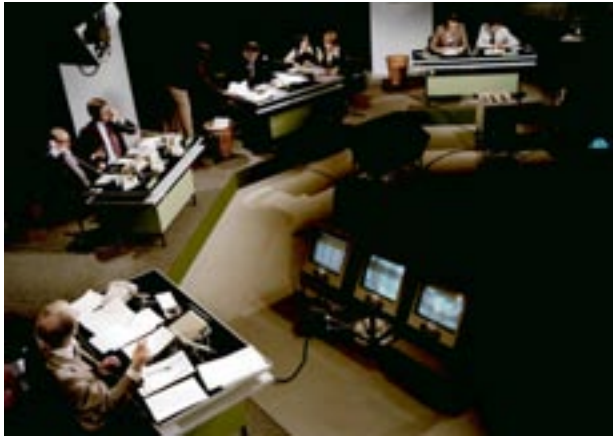
Abb. 8: Wahlsendung 1976

den übrigen Perioden in dieser Phase am häufigsten zu Wort. Bei beiden Fernsehprogrammen hatten von 1969 bis 1976 jeweils mehrere Journalisten des eigenen Senders als Kommentatoren in den Wahl-