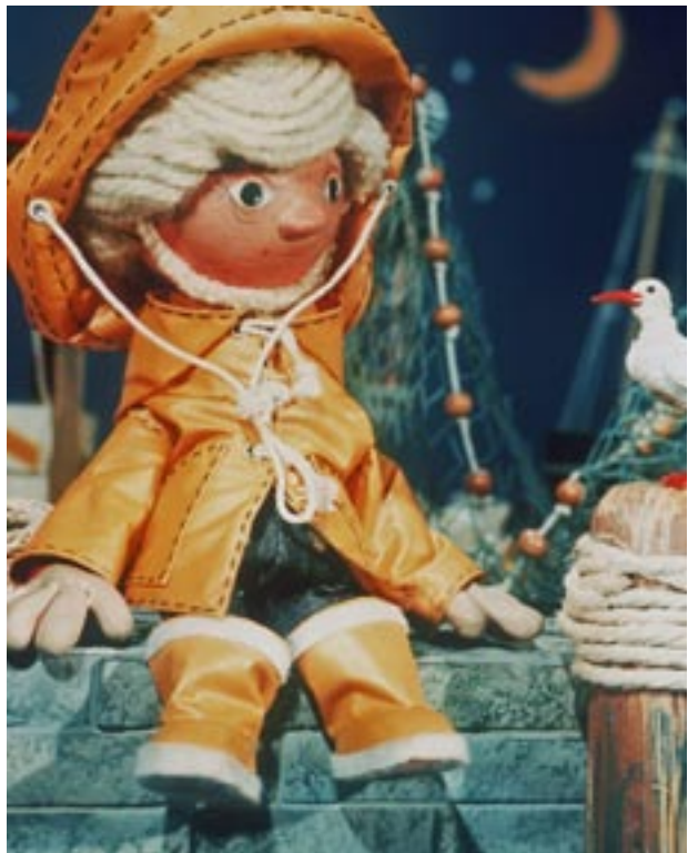
Das Sandmännchen der ARD

nikorientierte »Ost-Sandmännchen« hat noch heute bekennende Anhänger, ebenso wie sich das »West-Sandmännchen« der Beliebtheit der Kindergeneration auch heute erfreut. Allerdings wird die Sendung nicht mehr zentral im Hauptprogramm der ARD ausgestrahlt, sondern auf dem Sparten- und Kinderkanal KIKa. Damit ist eine generationsweite oder gar generationsübergreifende Identitätsstiftung nicht mehr gegeben. Derzeit ist Radio Berlin-Brandenburg RBB in Berlin und Potsdam für die Sendestrecke »Sandmännchen« ARD-weit redaktionell zuständig.