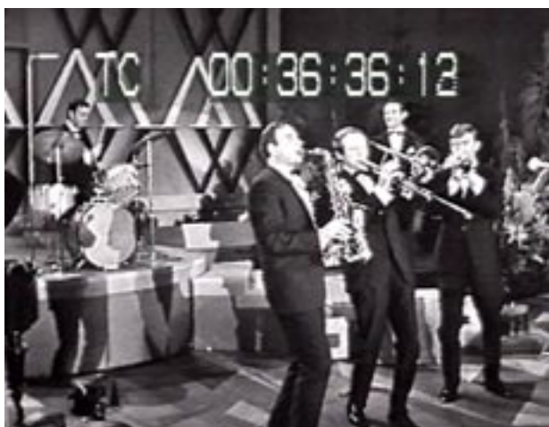
Abb. 3: Wahlshow des ZDF 1965

Beide Sender orientierten sich dabei an der damaligen englischsprachigen Wahlberichterstattung. Während die ARD sich die Sendungen der US-Networks und von CBS zum Vorbild nahm, um zu beweisen, dass ihr Programm das politisch gewichtigere Sendesystem in der Bundesrepublik sei, orientierte sich das ZDF an den »election parties« in Groß-