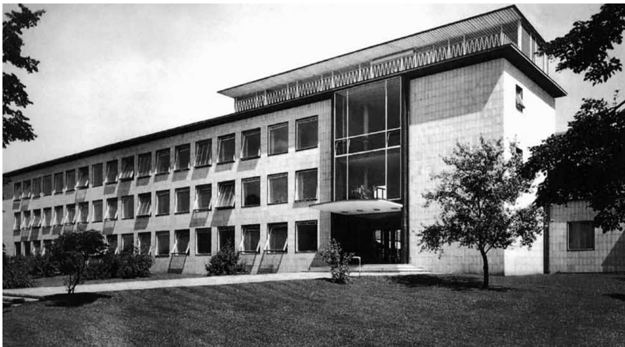
Das neue Funkhaus am Maschsee in Hannover, 1951/52.