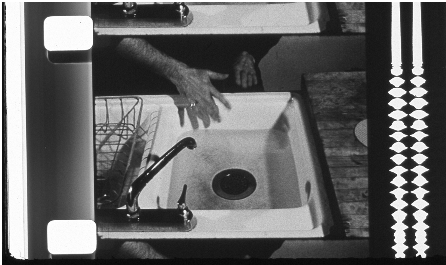
Abb. 4: Sink

Sync Sound das conundrum von Tonfilm noch einmal als Überlagerung mehrerer Ebenen verdichten: