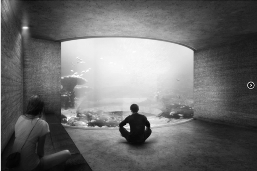
Abb. 3: Visualisierung des Projekts NEMO