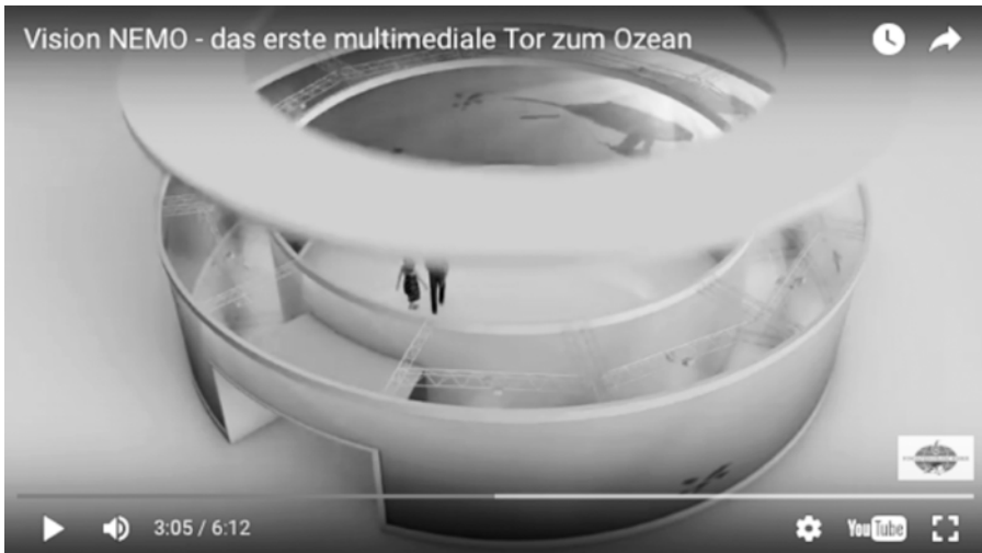
Abb. 4a u. 4b (rechte Seite): Filmstills aus »Vision NEMO – das erste multimediale Tor zum Ozean« (03:05 und 03:06)

bar, was sich in der Wand befindet: nicht Wasser und Fische, sondern Luft und Technik.