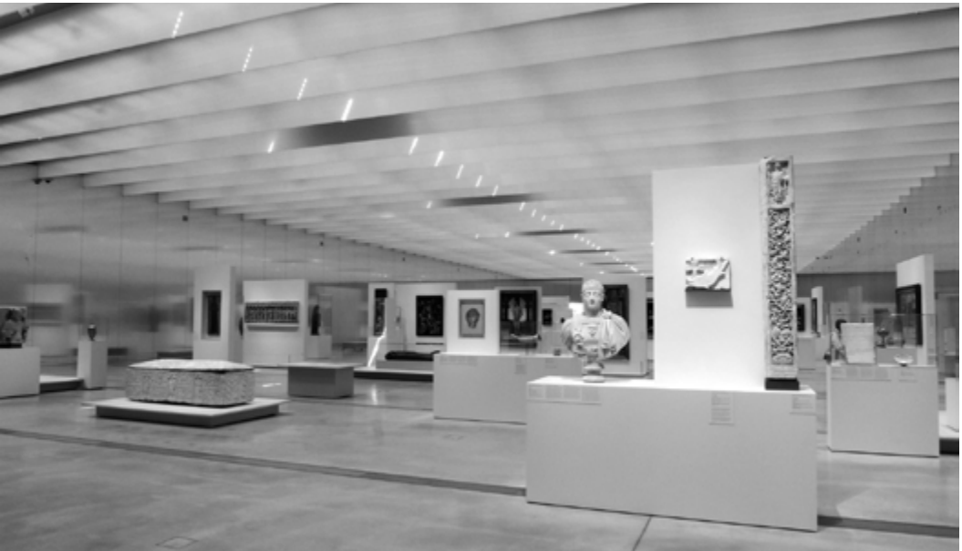
Abb. 4: SANAA, Louvre Lens, La Galerie du Temps