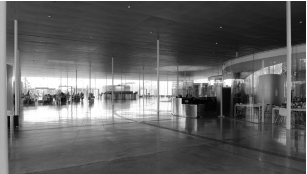
Abb. 2: SANAA, Louvre Lens, Eingangsbereich

In die großzügige Eingangshalle sind kreisrunde Glasräume eingestellt, in denen sich ein Museumsshop, Auditorien, Handbibliotheken, Lese- und Seminarräume befinden. In den polierten hellen Betonstrich sind gekurvte Rillen eingebracht, die die große Fläche strukturieren. Dünne, weiße, fast unsichtbare, unregelmäßig verteilte runde Stützpfeiler stehen wie Stäbe im Raum und wirken kaum wie tragende Elemente. An zwei langen Theken aus poliertem Aluminium befinden sich Ticketschalter und Ausgaben für elektronische Guides. An verschiedenen Stellen sind Projektionsflächen und Screens angebracht, die auf aktuelle Veranstaltungen hinweisen. Im hinteren Bereich der Halle sieht man eine Cafeteria und einen Picknick-Bereich. Garderobe, Toiletten, offene, einsehbare Werkstätten und Archive liegen im Untergeschoss – der sogenannten ›Discovery Area‹.