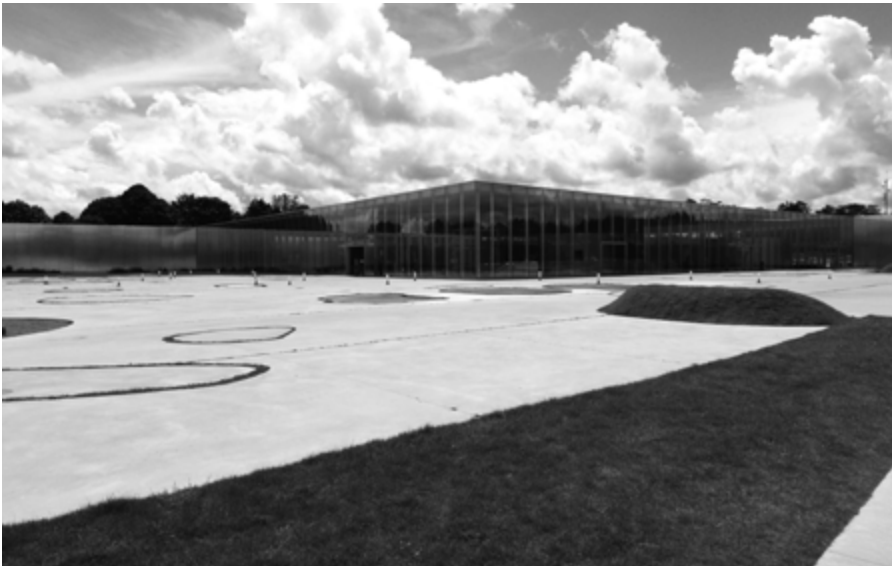
Abb. 1: SANAA, Louvre Lens

betont die Bedeutung des Außenraumkonzeptes und die Einbindung in die soziale Umgebung: »it is not the building alone that is important, but the people, the art, the landscape, the whole ensemble«. 21 Die 360 Meter lange Fassade der teilweise leicht geschwungenen, hintereinander geschalteten Baukörper erstreckt sich wie ein nicht enden wollender Glaspavillon über das Gelände hinweg. Die in feine, vertikale Streifen gegliederte Glas- und Aluminiumfassade reflektiert das Gelände. Dabei gleicht die Anlage einem Arrangement aus eleganten, hyperpräzisen, aber unpräzisen Industriehallen, die aus verfeinerten Standardelementen gefertigt wurden. Verglichen etwa mit einer Produktionshalle, die SANAA für den Campus des Büromöbelherstellers Vitra in Weil am Rhein entworfen hat, lassen sich keine kategorialen Unterschiede in der Architektursprache erkennen.