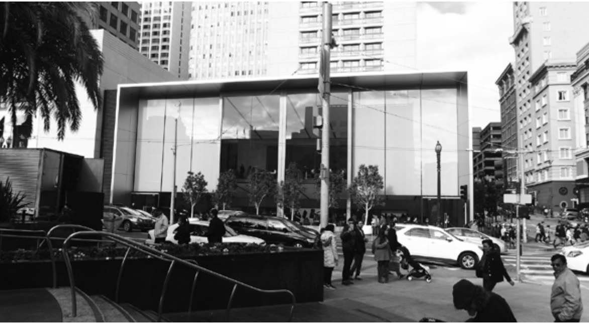
Abb. 5: Foster + Partners, Apple Store, Union Square, San Francisco

Mitte eine sich über die ganze Höhe des Gebäudes erstreckende zweiflügelige Schiebetür, die aus jeweils zwei 12,80 Meter hohen, in einen Aluminiumrahmen gefassten Scheiben besteht. Diese Flügel können bei größeren Veranstaltungen geöffnet werden, sodass das Gebäude zum Platz hin weit offen steht. Auf dieses architektonische Element legt der Konzern ersichtlich besonderen Wert und hat die übergroßen Schiebetüren, die im Grunde bewegliche Fassadenelemente sind – wie übrigens eine ganze Reihe von Bauelementen –, umgehend patentieren lassen. 37 Die eigentlichen Eingangstüren für den Tagesbetrieb befinden sich links und rechts, am Rand der Fassade und bestehen aus überaus unscheinbaren Standard-schwingtüren. Horizontal ist das Gebäude lediglich durch die Zwischendecke eines eingezogenen Galeriegeschosses im Inneren gegliedert; die Außenfassade selbst weist keine horizontalen Gliederungselemente auf.