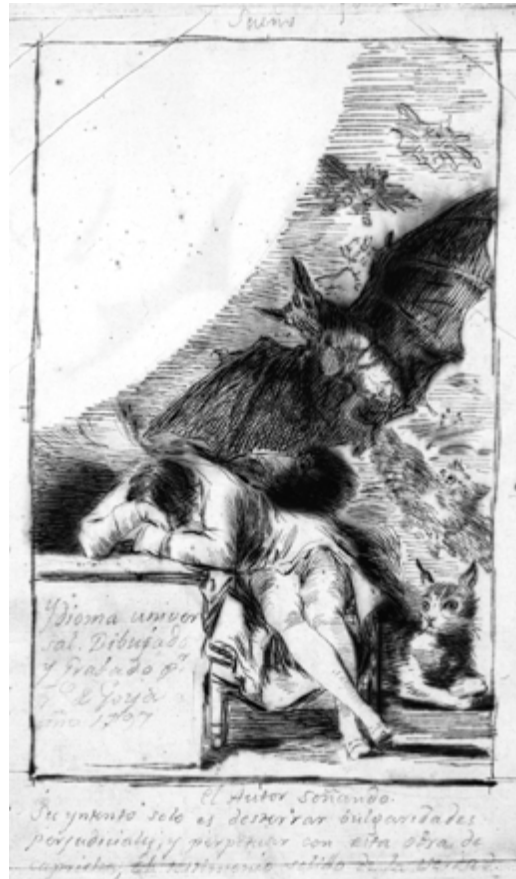
Abb. 3: Francisco de Goya: Ydioma universal , Federzeichnung, 1797

Wenn Goya sich auf die Seite dieses Anderen der klassifikatorischen Repräsentation, auf die Seite des Monsters schlägt, so geschieht dies nicht, wie bei Chasaignon, in einer Hyperproduktion von außergewöhnlichen Gestalten, sondern vielmehr in einer Weise der Darstellung, die am Gewöhnlichen das Monströse