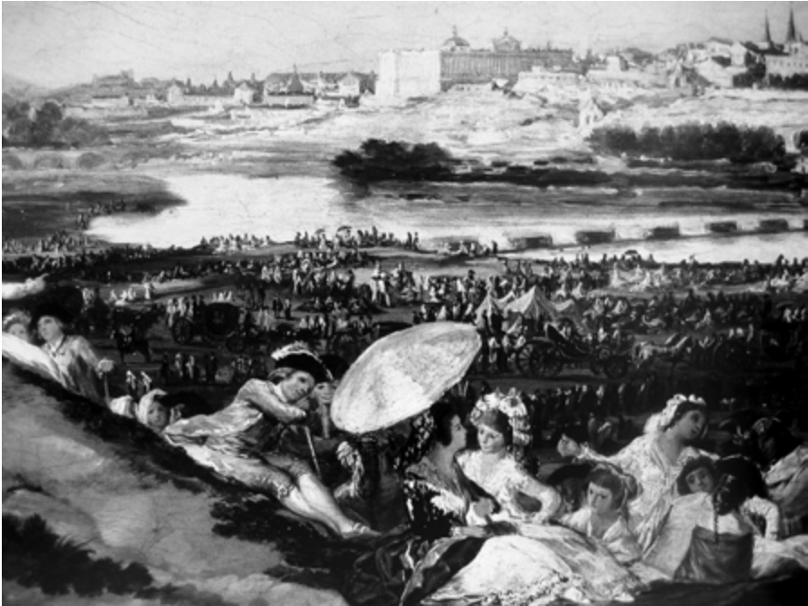
Abb. 4: La pradera de San Isidro , 1788, Museo del Prado, Madrid

lichkeit verhaftet; die symbolischen Kombinationsspiele bewegen sich innerhalb der klassischen Episteme der Repräsentation; dagegen bringt der Rückgang auf das körperlich ›Reale‹ des Monsters, auf das »Dunkel des schöpferischen Grundes« 58 eine neue Form der ästhetischen Wahrnehmung hervor, deren Prinzip, wie Walter Benjamin sagt, nicht die Gestaltung, sondern die »Entstaltung des Gestalteten« ist: »Es ist aller Phantasie eigen, daß sie um die Gestalten ein auflösendes Spiel treibt.« 59