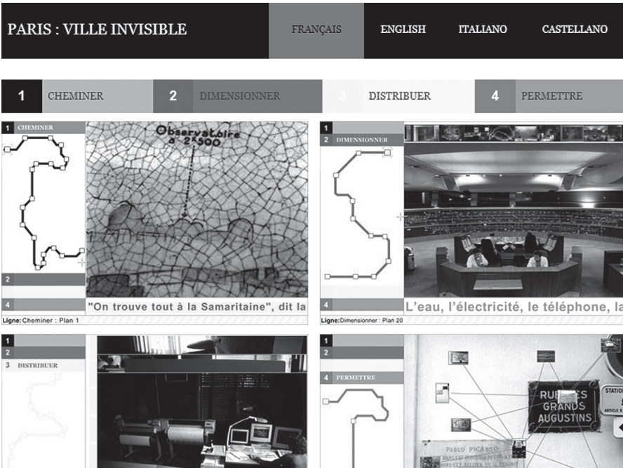
Abb. 2: Website Paris: Ville invisible

bes Netzwerk bleibt in allen Punkten lokal.« 60 Das Konzept der Metrologie impliziert damit eine spezifische Flachheit des infrastrukturellen Netzes, derzufolge es möglich ist, »sich lokal überallhin auszubreiten« und so das Lokale wie das Universale zu umgehen. 61