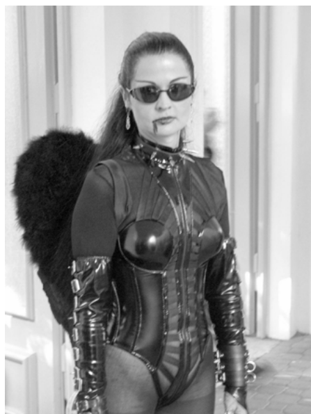
Abbildung 8: Cyber-SM-Angel