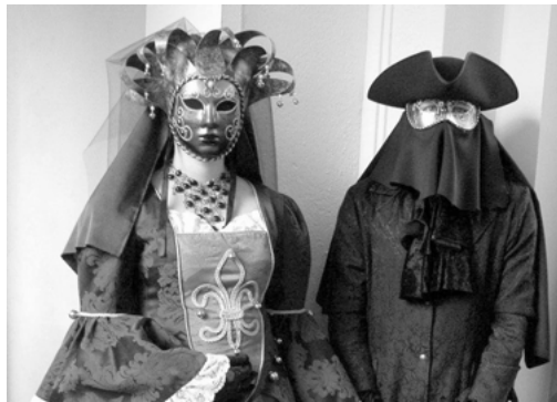
Abbildung 1: Historie 1

Typ 1 Historische Retrofigur: In den 1980er Jahren bezieht sich die Szene nur in ihren Bildwelten auf das Mittelalter (siehe Gotik-Bild der Romantik). In der Gegenwart werden die „mittelalterlichen“ Locations zur konsequenten Umrahmung einer spezifischen Kleidung.