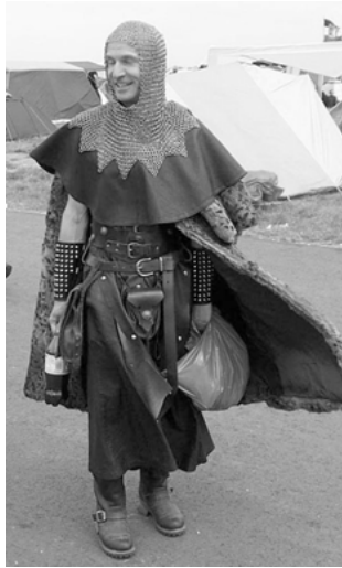
Abbildung 4: Historische Retrofigur: Ritter

ckung, eine Kettenmütze, wie sie die mittelalterlichen Turnierkrieger unter dem Helm trugen. Zeitgenössische Elemente sind schwarze Motorradboots, beide Unterarme sind mit breiten Nietenstulpen bedeckt, wie bei einer mittelalterlichen Panzerung, das Accessoire stammt aus dem Metal-Bereich. Er ist ein Pseudo-Ritter ohne Pferd, die Diskrepanz zwischen historischer Inszenierung und der Umgebung eines Festivalgeländes, wird deutlich.