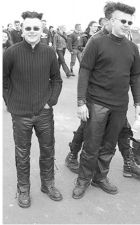
Abbildung 6: Dark Waver

Dem Typ 4: Cyberpunk lässt sich eine Vielfalt von Erscheinungen zuordnen, von Industrial Fans über die SM-Anhänger (seit den 1980ern von „Die Form“ initiiert) bis hin zur Zukunft im Cyberpunk. Modische Kennzeichen sind Schnallen wie in den 80ern, hinzukommen Materialien wie Schläuche, Plastik, Gummiplatten in Anknüpfung an SF-Comics (Interview Monaco, Besitzer des Szeneladen X-trax ). Das abgebildete Paar (Abb. 7) trägt schwarze Kleidung. Lederhose und eine Schweißbrille sind weitere Gemeinsamkeiten. Die Frau trägt die Brille auf dem Kopf als Haarschmuck, der Mann hat seine Brille mit rötlichen Gläsern an die Weste gehängt. Das Outfit des Mannes wirkt durch das Barett und die schwarzen Handschuhe militärisch. Er trägt eine Weste mit Schnallen und sehr vielen Taschen (vgl. Fotografen, Kameramann-Weste). Damit knüpft er an einen zeitgemäßen „Future-and-Utility-Look“ (vgl. Richard 2001) an. Die Frau trägt über einem schwarzen Oberteil und einer schwarzen Hose ein Ensemble aus grüner Fallschirmseide. Von einer breiten Schärpe sind an zwei kleinen Karabinerhaken abtrennbare Beinteile aufgehängt, die die Kniepartie freilassen. Beide präsentieren sich als Agenten aus der Zukunft mit technoidem Outfit, technische Funktionalität suggerierend. Die Verspieltheit der Accessoires zeigt, dass hier ein magisches Bild des Technoiden erzeugt wird.