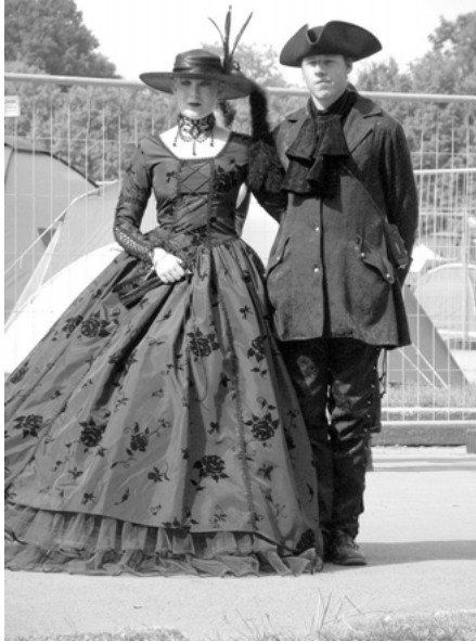
Abbildung 2: Historie 2