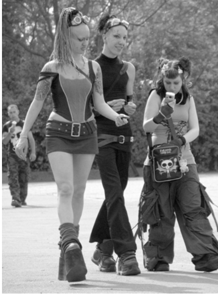
Abbildung 9: Darktechnocrossover