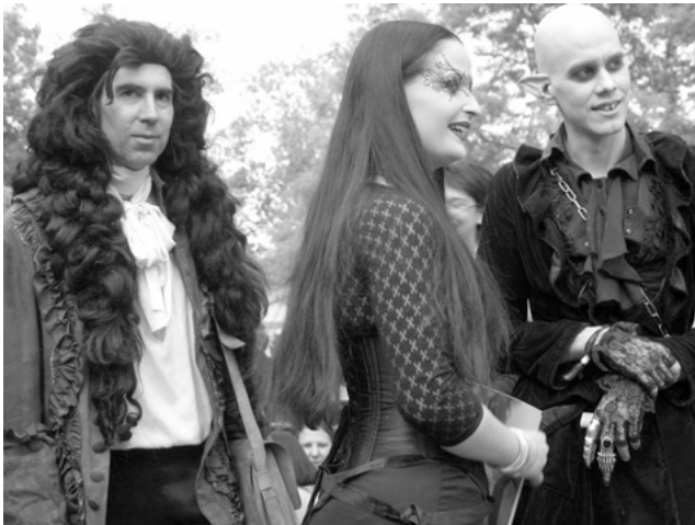
Abbildung 3: Historiennosferatu

Der abgebildete Ritter (Abb. 4), ein Mann mittleren Alters, ist mit einem mehrschichtigen Kostüm bekleidet. Es besteht aus einem Umhang mit Leopardmuster, einem schwarzer Lederrock und einer den Oberkörper bedeckenden Lederpelerine und einem zweifach breiten, braunen Leibgurt aus braunem Leder, an dem verschiedene Taschen hängen. Vor dem Körper trägt er eine Art Geldbeutel. Sehr prägnant ist seine Kopfbede-