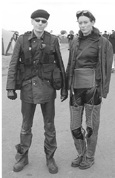
Abbildung 7: Cyberpunk