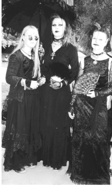
Abbildung 5: Kinder der Nacht

Typ 3: Dark Wave ist hauptsächlich durch die Farbe Schwarz und die Materialien Leder und Lack bestimmt. In diese Kategorie fallen die Anhänger der elektronischen Musiksubstile, Waver und EBM (Electronic Body Music-)Fans mit ihren Band T-Shirts. Beide abgebildeten Männer (Abb. 6) lassen einen Minimalismus in der schwarzen Kleidung erkennen. Sie ist nüchtern, bis auf die Nietenarmbänder schmucklos. In ihrem risikolosen Stil greifen sie die Klassiker der Szene aus den 1980er Jahren auf, wie seitlich geschnürte Lederhose und DocMartens. Beide tragen die typische Waverfrisur mit kahlrasierten Seiten und breitem, schwarzgefärbtem Kamm mit relativ kurzem Deckhaar. Nur die Sonnenbrille als Rekurs auf den modernen Dracula aus Coppolas Film „Bram Stoker’s Dracula ist erwähnenswert. Sonst ist dieser Typus ästhetisch wenig innovativ und hat kaum Bezug zu magischen Welten.