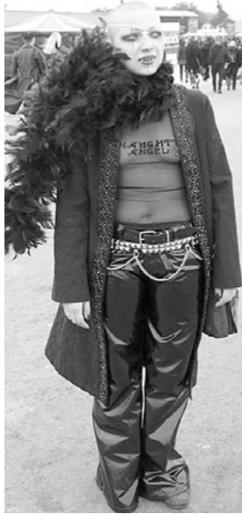
Abbildung 10: Vampirmädchen

Die Inszenierung in den verschiedenen Typen führt bei den Gothics zu einer mehrstufigen magischen Zeitreise vom Mittelalter bis in die Zukunft. Die ersten beiden sind historisch orientiert, hier werden die meisten magischen Symbole getragen, am konzentriertesten bei den Kindern der Nacht. Die Dark Waver zeigen sich gegenwartsverhaftet, die Cyberpunks zukunftsorientiert.