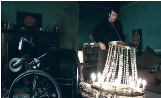
Abb.4: Tod durch Kronleuchter

Die Gefährdungslage durch sowohl die agency der non-humanen Aktanten als auch die Wohnumgebung als solche wird den Betrachtenden durch eine erste Kamerafahrt durch die Wohnung vorgeführt. Gerade auf Kronleuchter, Klarinettenständer und Fensterbank verharret der Kamerablick um anzudeuten was kommen wird: Die absurd unwahrscheinlichsten Kettenreaktionen und unglücklichen Umstände, die in spektakuläre und tödliche Unfälle münden werden. Dieser Film ist eine von Galgenhumor untermalte Ausstellung eines Unfalltheaters des Absurden. Der Protagonist ist ein Pechvogel wie er im Buche steht, ein phlegmatischer, unscheinbarer und deswegen erfolgloser Filmschauspieler, der seinen schwer beeinträchtigten, vollständig gelähmten Bruder pflegt. Er wird von seiner Freundin verlassen, von seinem Vermieter drangsaliert und von seinem besten Freund und Nachbarn Pierce, einem ebenso erfolglosen wie alkoholkranken Drehbuchautor ausgenutzt.