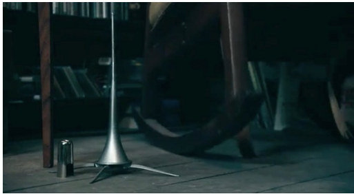
Abb.2 Der Klarinettenständer