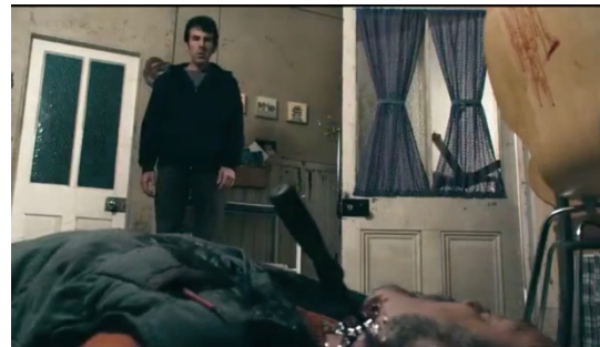
Abb.5: Der Sturz in der Küche

In einer Kettenreaktion verunfallt in seiner Wohnung im Laufe des Films zuerst der Hund seiner Freundin: Dieser, in seinem Körbchen schlafend, wird von einem sich darüber befindenden, herabstürzenden Hängeregal erschlagen. Daraufhin kommt sein Bruder durch den grotesken, viel zu großen Kronleuchter an der Decke des Wohnzimmers ums Leben, da dieser sich von der Decke löst und ihn, da er sich nicht allein fortbewegen kann, fatal trifft (vgl. Abb. 4).