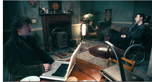
Abb.3: Das Wohnzimmer

Die Gefährdungslage durch sowohl die agency der non-humanen Aktanten als auch die Wohnumgebung als solche wird den Betrachtenden durch eine erste Kamerafahrt durch die Wohnung vorgeführt. Gerade auf Kronleuchter, Klarinettenständer und Fensterbank verharret der Kamerablick um anzudeuten was kommen wird: Die absurd unwahrscheinlichsten Kettenreaktionen und unglücklichen Umstände, die in spektakuläre und tödliche Unfälle münden werden. Dieser Film ist eine von Galgenhumor untermalte Ausstellung eines Unfalltheaters des Absurden. Der Protagonist ist ein Pechvogel wie er im Buche steht, ein phlegmatischer, unscheinbarer und deswegen erfolgloser Filmschauspieler, der seinen schwer beeinträchtigten, vollständig gelähmten Bruder pflegt. Er wird von seiner Freundin verlassen, von seinem Vermieter drangsaliert und von seinem besten Freund und Nachbarn Pierce, einem ebenso erfolglosen wie alkoholkranken Drehbuchautor ausgenutzt.