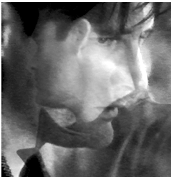
Abbildung 2: Filmmontage aus Lost Highway

»Godard hat gesagt, ein Film brauche einen Anfang, eine Mitte und einen Schluss, aber nicht unbedingt in dieser Reihenfolge.« 67