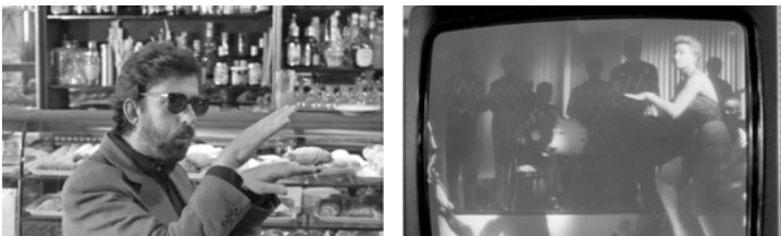
Abb. 8 & 9

Moretti ahmt dabei eine Tanzeinlage von Silvana Mangano nach aus dem Film ANNA von 1951, einem der größten Nachkriegserfolge des italienischen Kinos (Abb. 8 & 9). Mit dieser Szene demonstriert Moretti, wie aus der Zuschauerposition agiert werden kann: nachahmen, nachspielen und dabei Fragmente in den eigenen Alltag integrieren. Für diese beispielhafte Zuschauer-Strategie benötigt man nicht einmal