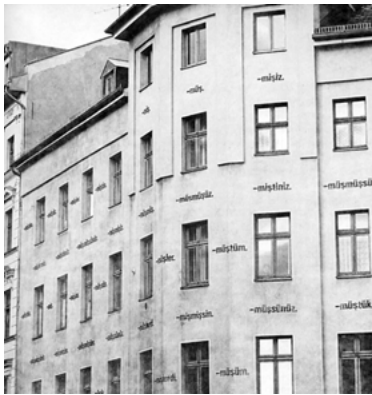
Abb. 6: Ayşe Erkmen, Evde , 1995

An einem Haus auf der Kreuzberger Oranienstraße befindet sich seit 1995 eine Installation von Wortfragmenten, die ebenfalls einen öffentlichen Gebrauch impliziert, Ayşe Erkmen's Evde (=Am Haus). Sie richtet sich nicht nur an den türkischen Teil der Bevölkerung in Kreuzberg (Abb. 6). 10