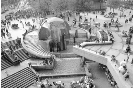
Abb. 2: Joachim Schmettau, Erdkugelbrunnen , 1983

Granit (Abb. 2). 6 Er ragt nicht vertikal in die Höhe sondern erstreckt sich horizontal in die Breite. Der Brunnen ist als Attraktion für Besucher im Einkaufszentrum der City West gebaut worden.