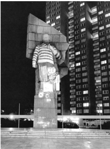
Abb. 4: Krzysztof Wodiczko, Lenin-Projektion, 1990

1989 brachen die beiden politischen Systeme Berlins (und Deutschlands) mit ihren durch Abgrenzung voneinander gefestigten mentalen Gewissheiten zusammen. Es ging alles sehr schnell, förmlich über Nacht verloren die Monumente im Osten Berlins ihre Bedeutung, als z.B. der Hausmeister des Wohnblocks schon im November 1989 Tomskis Lenin die Nachtbeleuchtung verweigerte und ihn somit freigab als Projektionsfläche für ein Lichtbild, das der polnische Künstler Krzysztof Wodiczko auf das steinerne Monument projizierte. Er hat das Denkmal kurzzeitig mit einer Diaprojektion konterkariert (1990) (Abb. 4), doch es war dann deren mediales Nachbild als Postkarte, das die Auseinandersetzung um das Erbe des DDR-Sozialismus beförderte. 8