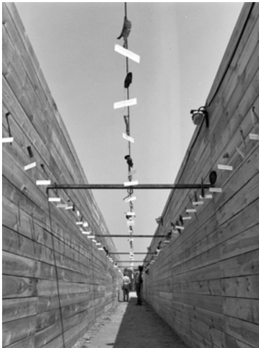
Abb. 5: Ilja Kabakov, Zwei Erinnerungen an die Angst , 1990

Auch Ilja Kabakovs Außenraumsulptur Zwei Erinnerungen an die Angst (Abb. 5) trug in ihrer Dualität der besonderen Situation Berlins Rechnung. 9 Im innerstädtischen Brachland am Potsdamer Platz hatte Kabakov zwei Gänge zwischen Holzwänden errichten lassen, die auf den ersten Blick von Bauzäunen nicht zu unterscheiden waren.