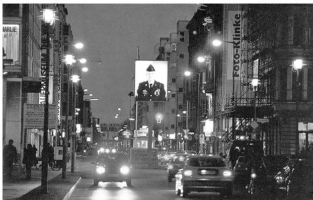
Abb. 9b: Frank Thiel, Übergänge , 1998

auch als individuelle Menschen, sie schauen gleichsam aus ihrer Uniform heraus, mit einem Blick, der die Rolle des Soldaten verläßt und sich an das menschliche Gegenüber, das des Fotografen beziehungsweise implizit das des Betrachters wendet.