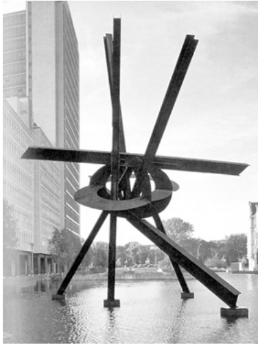
Abb. 10: Mark di Suvero, Galileo, 1996

Das Werk gehört zu den Skulpturen im Niemandsland Berlins der 1990er Jahre, auf dem die großen Firmen aus dem Westen ihre zentralen Berlin-Repräsentanzen errichteten, mit ihnen kamen bevorzugt Werke der großen US-amerikanischen Bildhauer nach Berlin. Es ist nicht erstaunlich, dass eine Profilbildung der Firmen nicht mit anspruchsvoller Architektur