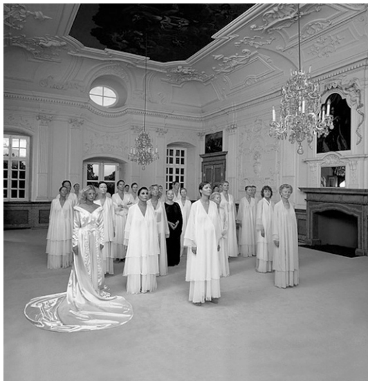
Abbildung 3 und 4: Vanessa Beecroft, VB 51, Performance mit Hanna Schygulla im Schloss Vinsebeck (Steinheim) am 30. August und 1. September 2002.