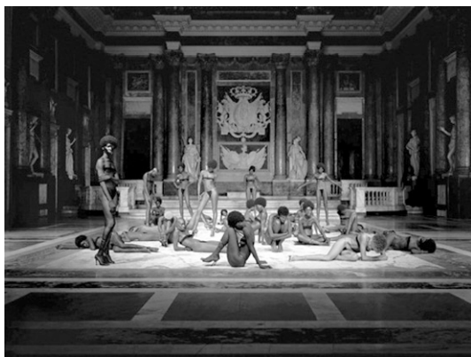
Abbildung 1 und 2: Vanessa Beecroft, VB 48, Performance im Palazzo Ducale (Genua) am 3. Juli 2001 vor dem G8-Gipfel.