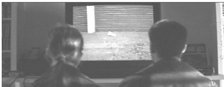
Abb. 2: AMERICAN BEAUTY (USA 1999, Sam Mendes)

Sicher ist es wenig angebracht, an Stelle der üblichen Annahmen über Digital- und Analogmedialität nun einfach von einem umgekehrten Verhältnis auszugehen. Vielmehr wäre zunächst auf die rhetorischen, genauer: die Rahmen-Strukturen zu achten, 19 deren Einsatz diese Umkehrung in AMERICAN BEAUTY – mit der parking lot -Szene als ihrem Dreh- und Angelpunkt – allererst möglich macht. Die Vorstellung, dass die zitierten digitalen Tüten- und Blätter-Aufnahmen ‚als solche‘ funktionieren, wäre nur zu naiv. Sie werden im Film außerordentlich sorgfältig vor- und nachbereitet; und noch während sie erscheinen, sind Rahmen über Rahmen am Werk (Abb. 2):