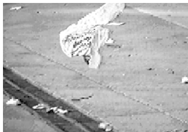
Abb. 4: INCIDENTS (USA 1997, Igor/Svetlana Kopystiansky); Ausstellung u.a.: Szenenwechsel XVI, 1999, Museum für Moderne Kunst, Frankfurt a.M.

1999 kam nicht nur AMERICAN BEAUTY auf die Leinwand; es gab auch eine Ausstellung, in der ein Künstlerpaar ein Video – INCIDENTS (USA 1997, Igor/Svetlana Kopystiansky) 31 – vorstellte, das in manchem einen Vergleich nahe legt. Sujet: vom Wind umhergeblasener Müll, so filmisch wie nur denkbar (Abb. 4).