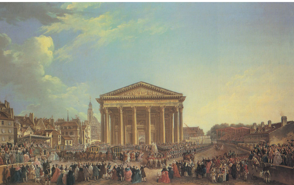
Abb. 3: Pierre-Antoine Demachy, Cérémonie de la pose de la première pierre de la nouvelle église Sainte-Geneviève, le 6 septembre 1765 , Öl auf Leinwand, 81 x 129 cm, Musée Carnavalet – Histoire de Paris, Paris.