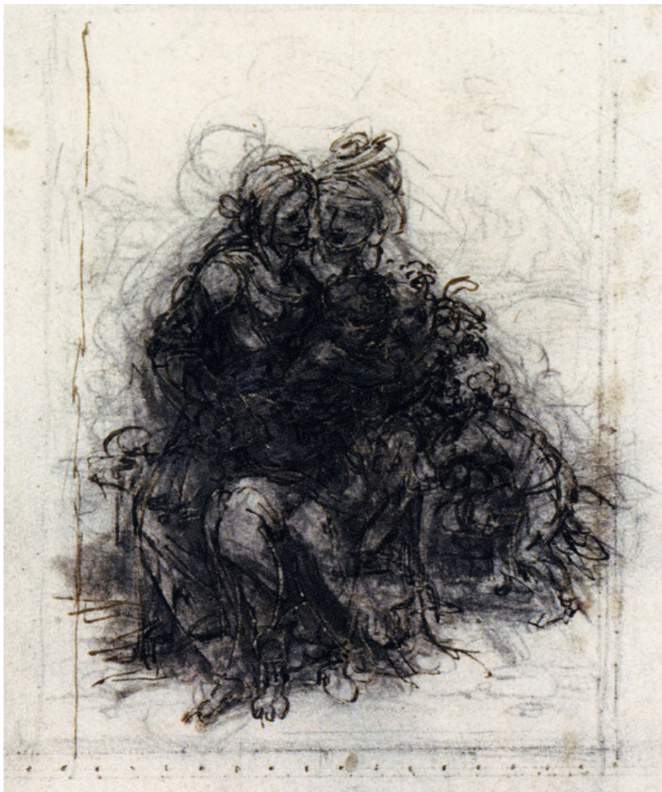
Abb. 1: Leonardo da Vinci, Maria und Anna mit Jesus und Johannes dem Täufer, Detail eines Studienblattes, 1506, Kohle, Feder, Aquarell, 26 x 19,5 cm, British Museum, London, Inv.-Nr. 1875-6-12-17.

»Etwas wehmütig denken wir an unsere alten 6B-Skizzen, scheinbare Schmuttel-Skizzen, die unscharf waren, in denen man, wenn sie durch fortwährendes Überzeichnen zu kleinen Papierhügeln angewachsen waren, plötzlich Dinge durchscheinen sah, durch mehrere Lagen transparenten Papiers; Dinge, die man nicht kannte bis dahin; Dinge, die man nicht gezeichnet hatte, die einfach so entstanden sind, scheinbar aus sich selbst heraus.« 6