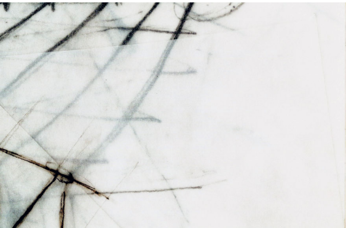
Abb. 2: Instanzierung einer Überlagerungen von 6B-Skizzen auf transparentem Papier, Zeichnung des Autors.