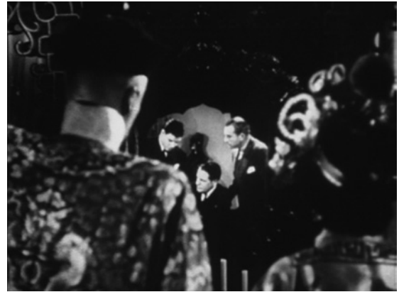
Abb. 2 Die Armbandkamera, Videostill aus der Filmserie Drums of Fu Manchu , Regie: William Witney, John English, USA 1940 (15 Folgen)