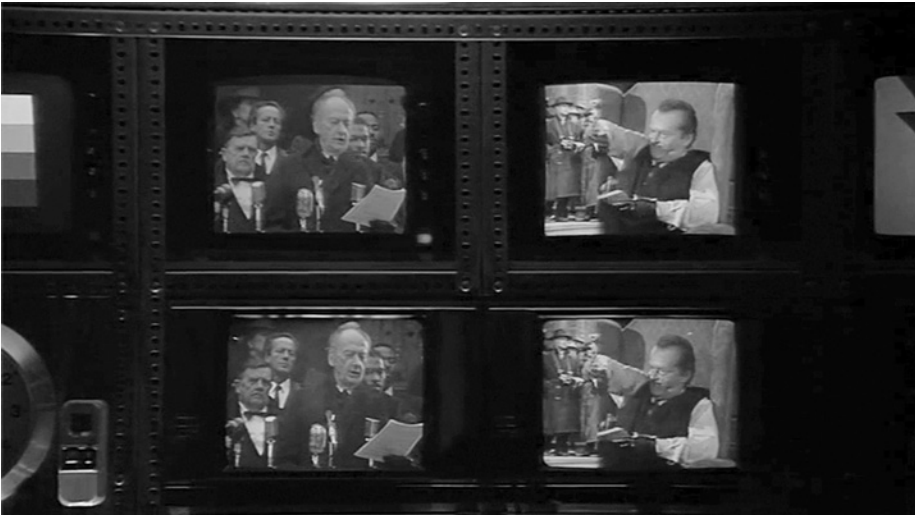
Abb. 6 Die Pressekonferenz des Bürgermeisters auf Bruce Waynes Monitoren, Videostill aus Batman , Regie: Tim Burton, GB/USA 1989

markierten Spiel mit den Prinzipien der Wiederholung und der Variation, der Ähnlichkeit und der Differenz. Burtons Film präsentiert sich vor dem Hintergrund der vielen Iterationen der Figur – vom heroischen (und dann ironisch-kitschigen) Strumpfhosen-Superhelden der Comics und des Fernsehens zum zwielichtigen dunklen Ritter der mit ihm (und durch den Comic-Autor Frank Miller) <gereiften> Graphic Novel. Für den Film spielt diese unruhige Vorgeschichte eine wichtige Rolle. Es geht hier ähnlich wie in den zuvor betrachteten Narrativen um Fu Manchu und Fantômas zum einen darum, das Seriene Gedächtnis für die Figur auf den neuesten Stand zu bringen. 16 Zum anderen zielt Burtons Batman auf die Bilanzierung einer aktuellen Medienumbruchsituation, um die Figur zukunftssicher zu machen. Und für beide Zwecke wird ein weiteres Mal der Fernseher emblematisch.