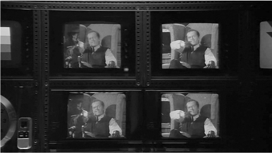
Abb. 8 Joker usurpiert den Bildschirm, Videostill aus Batman

auch dieser serielle Meisterverbrecher ausschließlich als Disfiguration. Und natürlich spiegelt sich dieses prekäre Arrangement in der Gestalt von Batman selbst, der mit seinem Alter Ego Bruce Wayne ebenfalls als Teil des Spiegelkabinetts der Identitäten und Personae verstanden werden muss, das der Film von 1989 und die plurimedialen seriellen Inszenierung des Batman-Narrativs insgesamt vorführen.