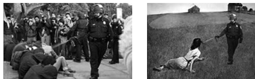
Abb. 7/8 Meme-Familie, Pepperspray Cop

Andererseits sind Meme selbst Produkte von Individuationen. Meme gehören zu einer ästhetischen Kraft, die individuiert, aber sie arbeiten zugleich auch aus dem Inneren ihrer techno-ästhetischen Form oder Struktur, beispielsweise der