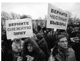
Abb. 1 «Wir wollen die Schneewinter zurück. Wir wollen faire Wahlen zurück», Bolotnaja-Platz-Demonstrationen, 10.12.2011

Die ästhetische Morphogenese hat sich fest in digitalen Formen verankert. Nicht nur bedienen sich heute Teenager für ihre Späße der Erzeugung und Verbreitung von Memen, auch politische Unzufriedenheit setzt in ihrem Protest auf die Sprache der Meme oder der viralen kulturellen Produktion. So waren viele Plakate der Bolotnaja-Platz-Demonstrationen gegen Putin, die am 10. Dezember 2011 stattfanden, humorvoll, mit Nonsense-Slogans wie «Wir wollen die Schneewinter zurück», und dabei ganz so, als ob sie dazu gemacht worden wären, fotografiert und auf den Seiten der Sozialen Netzwerke gepostet und weitergepostet zu werden.