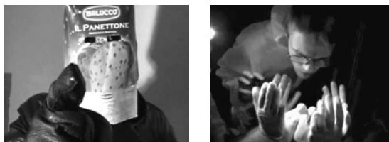
Abb. 4 Lokale Aneignung globaler Stoffe – Darth Vader mit Panettone-Helm