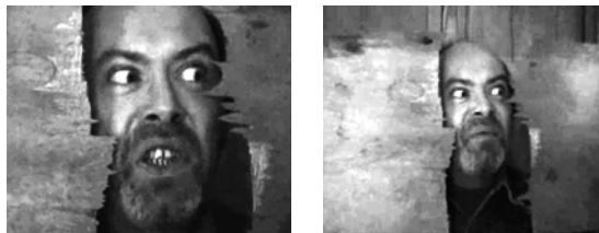
Abb. 2 Shining Sweded , 2008 Illusionsbruch als ästhetisches Prinzip

Gerade die improvisierten Requisiten verleihen dem geschwedeten Film den anderswo vermissten Hauch des Authentischen. Während die professionellen Produktionen nichts dem Zufall überlassen, kann die Indie-Ästhetik eben davon profitieren, dass sie die Kontingenz wieder spürbar macht und somit Vertrauen in die Bilder schafft und den Zuschauer aus seiner anstrengenden Rezeptionshaltung des Misstrauens erlöst. Ein deutliches Zeichen dafür, dass es um Vertrauen geht, ist die ständige Inszenierung des Illusionsbruchs im geschwedeten Film und zwar gerade dann, wenn Illusion möglich wird. In Shining Sweded 16 sieht der Darsteller dem Schauspieler Jack Nicholson mitunter zum Verwechseln ähnlich, und beim berühmten Blick durch die mit einer Axt gespaltene Badezimmertür kann man Original und Remake kaum noch unterscheiden. Und was tut das Indie-Remake daraufhin? Die Kamera fährt zurück und zeigt, wie der Darsteller zwei Holzstücke in die Luft hält, um die Illusion einer Tür zu schaffen (Abb. 2). Die Nachahmung will nicht täuschend echt sein, sie ist echt täuschend und legt ihr Spiel offen. Sie thematisiert sich als improvisierte Nachahmung und zieht damit bei aller spielerischen und ironischen Leichtigkeit eine selbstreflexive Ebene ein.