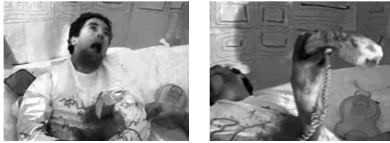
Abb. 3 Umdeutungen von Alltagsgegenständen – ein Telefonhörer als Alienbaby 17

Be Kind Rewind hatte genau dies vorgeführt: Bei der Schwedung von Boyz in the Hood wird einer Schaufensterpuppe, die auf dem Boden liegt, in den Kopf geschossen. Die Blutlache wird nun nicht mit Ketchup suggeriert, sondern durch eine Pizza Margherita, die man der Puppe unter den Kopf legt. In dieser unüblichen Funktion löst die Pizza Erstaunen aus und verblüfft gerade wegen der Zweckentfremdung durch ihre visuelle Effizienz. Was hier fasziniert, ist nicht die billige Pizza als alltäglicher Fastfood-Trash, sondern ihre metaphorische Dekontextualisierung mit ihrer Norm sprengenden und befreienden Wirkung. Die geschwedeten Filme lehren uns, dass der Alltag voller Überraschungen steckt, wenn man dessen utilitaristischen Rahmen aufbricht.