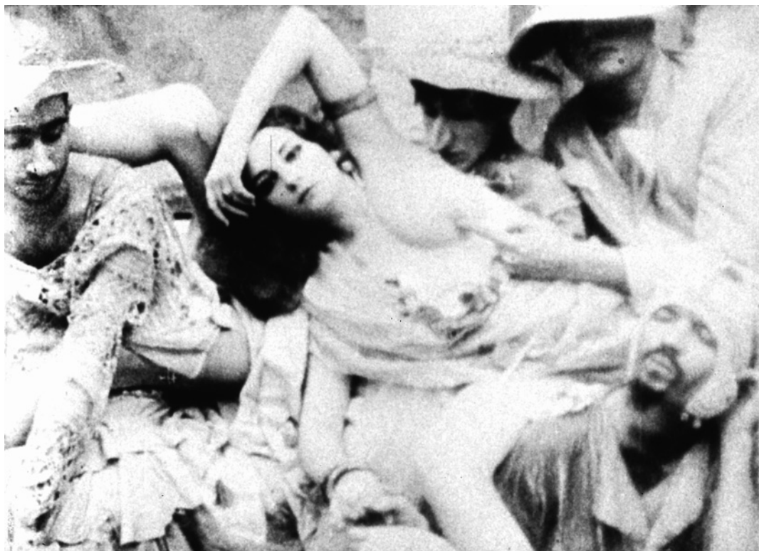
Jack Smith, Flaming Creatures 1963, Film Still