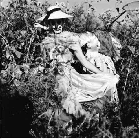
Abb. 2 Jack Smith, Untitled , ca. 1958–1962/2011, C-Print

finden. Man kann daher nur spekulieren, dass das verbindende Element zwischen den beiden Aussagen in dem bestehen muss, was Sontag als den Ästhetizismus von Camp identifiziert. Denn dieser Ästhetizismus wendet sich nach Sontag nicht nur gegen alles, was nach Natur auch nur riecht, sondern entzieht sich auch den politischen und moralischen Forderungen der Gegenwart durch einen sentimental Bezug auf die Vergangenheit.