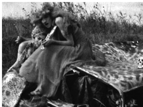
Abb. 3 Jack Smith, The Yellow Sequence , 1963–65, Frame Grab (Orig. in Farbe)

Ebenso bedeutsam ist der Übergang von Autowrack und Naturlandschaft. Es handelt sich hier offenkundig um eine Szene nicht so sehr der Historisierung von Natur als vielmehr der Naturalisierung von Geschichte. Die Kunstblumen auf Tiny Tims Hut wirken, als seien sie dem Verfall nicht weniger preisgegeben als das Auto, das Gras ringsum oder die Kreaturen selbst. Darin erweist sich Smiths Camp-Ästhetik als eine Ästhetik des 20. Jahrhunderts mit der des Barock verwandt. Wie diese stellt sie keine eskapistischen und ästhetizistischen Visionen der Vergangenheit vor, vielmehr hält sie die Empfänglichkeit des Werks der Geschichte für Verfall und Untergang fest. Indem sie aber dergestalt die spezifische Dialektik von Geschichte und Natur herausstellt, hält sie zugleich einem utopischen Moment die Treue. Und dies ist mein Argument gegen Sontags zweite Behauptung. Denn Sontag, so haben wir gehört, reduziert die