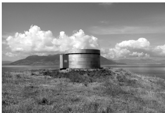
Abb. 7/8 Eine körperliche Erfahrung davon, was ein Medium ist, wie ein Bild entsteht: Camera Obscura, Gebäude Aegina, 2003 (beide Orig. in Farbe)

G.D. Erstens ist es eine rückbezügliche Behauptung: «Film ist. Punkt» heißt: Er existiert. Und alles, was danach folgt, ist nichts anderes als eine von unendlichen Möglichkeiten. Darum steht am Ende bei jedem Film: wird fortgesetzt. Selbst wenn wir nicht mehr weiterarbeiten, weil es immer schwieriger wird, Zugriff auf die Materialien und die Projekte finanziert zu bekommen, selbst dann ist es open end .