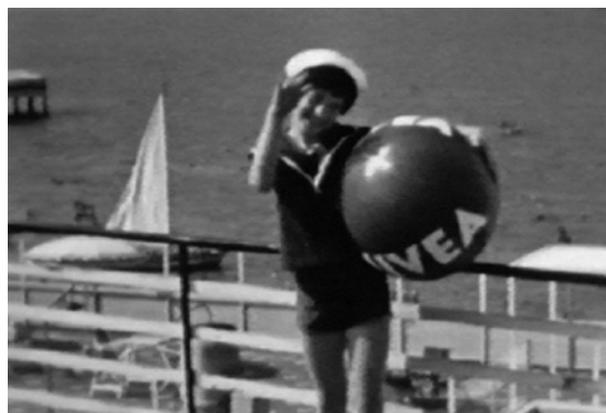
Abb. 3 (rechts) Im Eden des Kinsey-Archivs, Still aus Film ist a girl & a gun , 2009