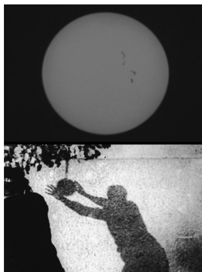
Abb. 5/6 (rechts) Gegenblicke aus dem frühen Kino, Stills aus Film ist. 12: Erinnerung und Dokument , Österreich 2002