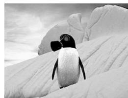
Abb. 7 «Die Antarktis im Widerstand! Pinguine: Unser Thema ist nicht das schmelzende Eis. Istanbul dichtes Gas 27°, Ankara in den Abendstunden Gas»