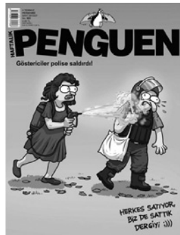
Abb. 5 «Wenn Du im Widerstand bist, bist du so schön, Türkei!» Titelseite Penguen , 6.6.2013