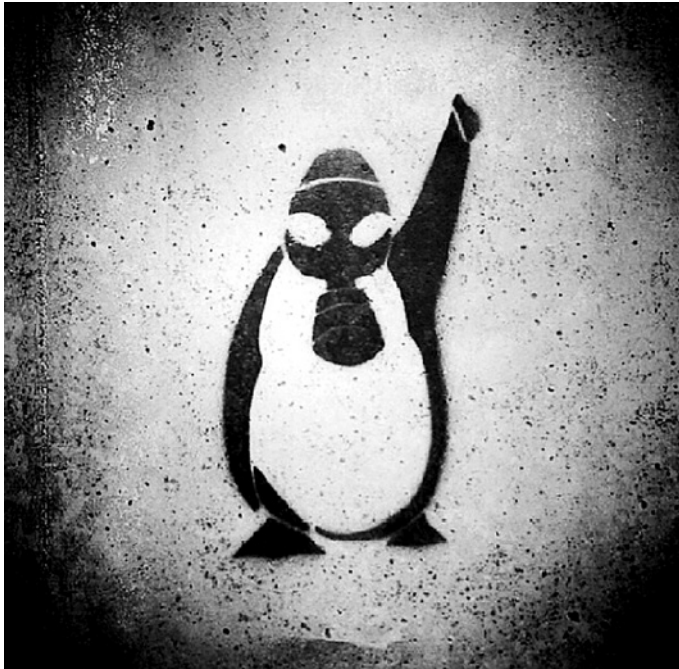
Graffiti, Istanbul, verbreitet via Twitter