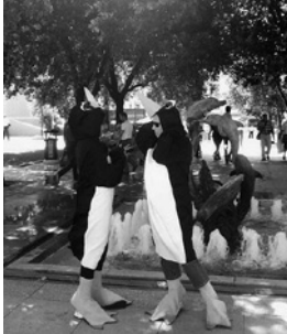
Abb. 4 «Penguins are already inside the #gezipark. Hope CNN Turk will make a documentary about them.» Begleittext zum Foto bei Twitter

die Aufmerksamkeit der Presse zu steigern suchen. Auf den Demonstrationen tauchten Menschen in Pinguin-Kostümen oder mit Pinguin-Stofftieren auf und fragten: «Heute sind wir hier, wo sind die Medien?»»