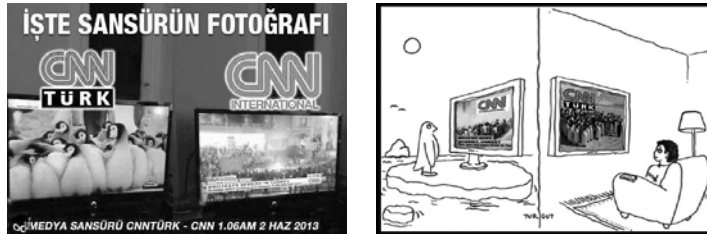
Abb. 1/2 Gegenüberstellungen von CNN Türk und CNN International, verbreitet u. a. via Twitter und Facebook

Der Sender wurde mit Zuschaueranrufen bombardiert, die in Überaffirmation mehr Pinguine forderten, und vor dem CNN-Gebäude fanden tags darauf Protest-Demonstrationen statt, die dazu aufforderten wenigstens diese Demo zu senden. Ein prominenter Interviewgast in einer Live-Sendung bei CNN Türk demonstrierte einige Tage später sein T-Shirt, auf dem ein Bild mit Pinguinen zu sehen war. Bei Erdoğan's Rückkunft von seiner Nordafrika-Reise, die von allen großen türkischen TV-Sendern live übertragen wurde, landete Halk TV , einer der wenigen regierungskritischen Sender, einen Coup: Zunächst übertrug der Sender auf seinem Splitscreen sowohl Live-Bilder von den Auseinandersetzungen am Taksim als auch vom Flughafen im Stadtteil Yeşilköy. Doch als der Regierende seine unversöhnliche Rede an die am Flughafen bereitstehenden Jubeldemonstrant_innen begann, wurde von Erdoğan's Gesicht zu Bildern ausrutschender, purzelnder Pinguine aus einer Naturdokumentation umgeschaltet: