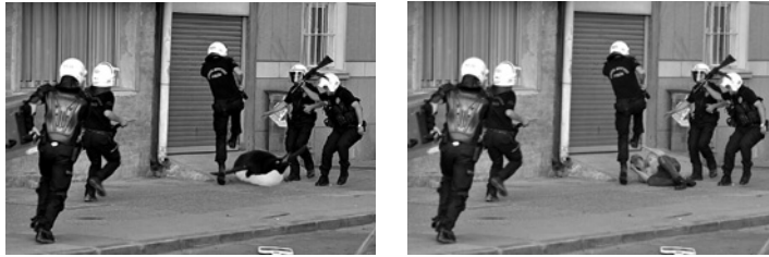
Abb. 10/11 «Alternative Pinguin-Dokumentation für Sie» – Fotomontage und Vorlage

Seit Juli tauchen die Pinguine als Protestgala auch in den Kommentaren auf den Facebook-Seiten von Fernsehsendern wie CNN Türk , Habertürk , NTV auf. Mittels des Sonderzeichen-Codes <(") 14 werden auf der Facebook-Seite der TV-Sender reihenweise Pinguinfiguren eingefügt: