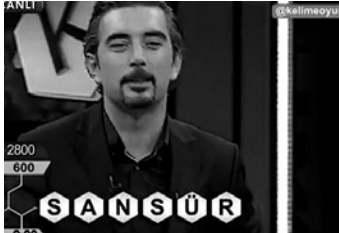
Abb. 14 Spiel mit Worten: Moderator mit Rätsellösung ZENSUR

Definitionen zeichneten 70 Minuten lang spielerisch ein Szenario der im Land stattfindenden Ereignisse und kommentierten die Lage, ohne über sie zu berichten.