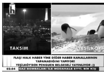
Abb. 3 «Flash! Halk TV tut wieder, was andere TV-Sender nicht tun! Aus Yeşilköy wird die Pinguin-Dokumentation ausgestrahlt:))»

In diesem Moment hatten die Pinguine eine eigentümliche Mehrdeutigkeit: Die Ausstrahlung der Doku wirkte als Metapher und Revanche für die Ignoranz der Sendepolitik von CNN. Dabei erschienen die possierlichen Tiere wie strauchelnde AKP-Jubler_innen, deren eigentümliche Lebensweise die Doku vorführt, und konnten gleichermaßen auch als Çapulcu gelesen werden, die auf metaphorisch glatten Straßen ihr Leben in Freiheit leben wollen. Diese eigentümliche Mehrdeutigkeit haben die Pinguine mittlerweile abgestreift – sie agieren vorwiegend als metonymische Gefährten, welche in ihrer Solidarisierung