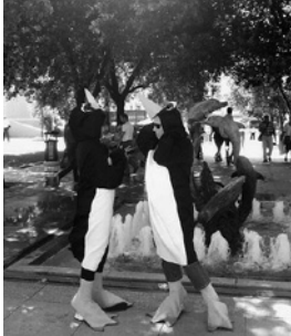
Abb. 4 «Penguins are already inside the #gezipark. Hope CNN Turk will make a documentary about them.» Begleittext zum Foto bei Twitter

die Aufmerksamkeit der Presse zu steigern suchen. Auf den Demonstrationen tauchten Menschen in Pinguin-Kostümen oder mit Pinguin-Stofftieren auf und fragten: «Heute sind wir hier, wo sind die Medien?»