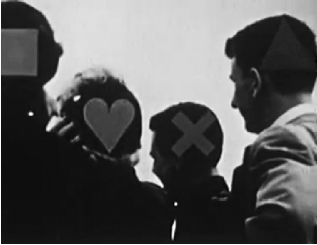
Abb. 1 A Communications Primer , Regie: Charles & Ray Eames, USA 1953, Screenshot (Orig. in Farbe)

Pluralisierung der Medien und so auch der Medienwissenschaft freien Lauf zu geben. Der unermüdliche Theorieimport aus anderen, auch naturwissenschaftlichen Disziplinen folgt dabei nicht selten auf dem Fuße. Und auch hier: Warum denn eigentlich nicht?