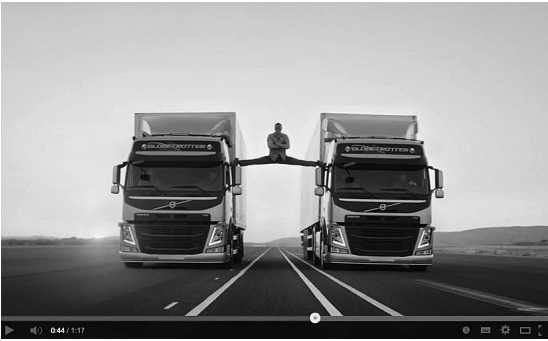
Abb. 6 Volvo Trucks – The Epic Split featuring Jean-Claude Van Damme, Werbefilm für Volvo, Videostill (Orig. in Farbe)

sich dafür entscheiden, was sie weiterleiten wollen, wie und wann und an wen.