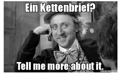
Abb. 5 (Orig. in Farbe)