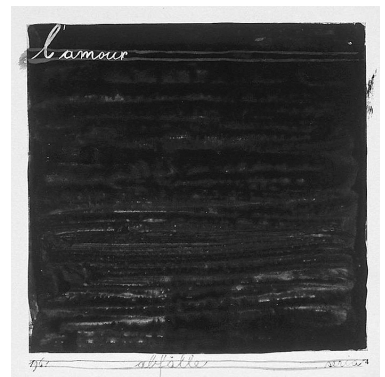
Abb. 4 Mangelos (Dimitrije Bašičević), L'Amour (Abfälle, a series) , 1961 (Orig. in Farbe)