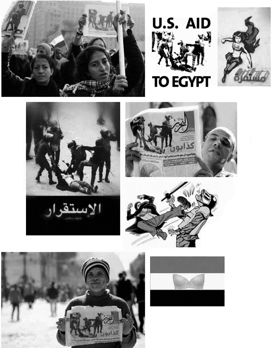
Abb. 4 Woman in the Blue Bra , Dokumente zusammengestellt von Rowan El Shimi (Orig. in Farbe)