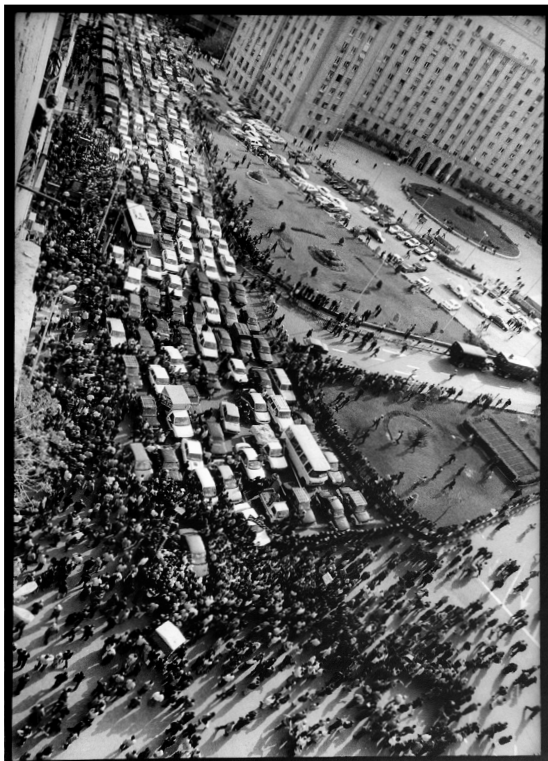
Abb. 8 Randa Shaat, aus der Serie Under the Same Sky, Kairo, 2003