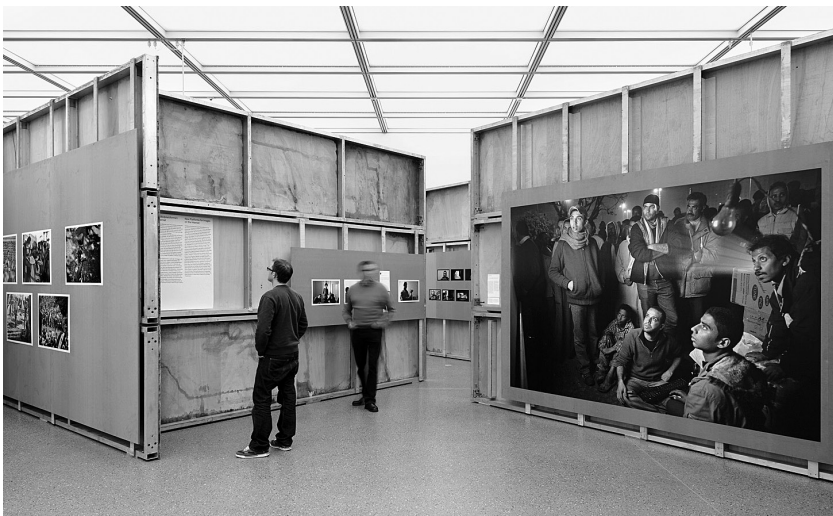
Abb. 9 Öffentliche Projektion von Facebook-Webseiten, Ausstellungsansicht Museum Folkwang Essen, 2012 (Orig. in Farbe)

F.E. Unser Konzept für die Präsentation der Ausstellung in Kairo wäre – und das wollen wir demnächst dort vor Ort diskutieren – zum Beispiel, von Elementen wie der Zeitungswand auszugehen, die viele ägyptische Besucher in Essen sehr begeistert hat. Aber generell bleibt die Frage, ob es sinnvoll ist, das Projekt in Kairo zu zeigen. Wir überlegen etwa, einzelne Arbeiten auszuwählen und ihnen neue Arbeiten gegenüberzusetzen, gerade aus dem journalistischen Bereich, die zeigen, wie die Bilder innerhalb dieser zwei, drei Jahre ihre Bedeutung verändert haben.