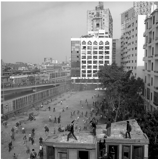
Abb. 6 Jonathan Rashad, aus dem Flickr-Album Egypt Clashes , Mai 2012 (Orig. in Farbe)