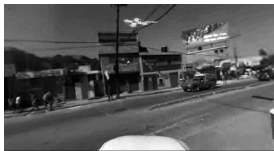
Abb. 1 Dodeca® 2360, Immersive Video Camera