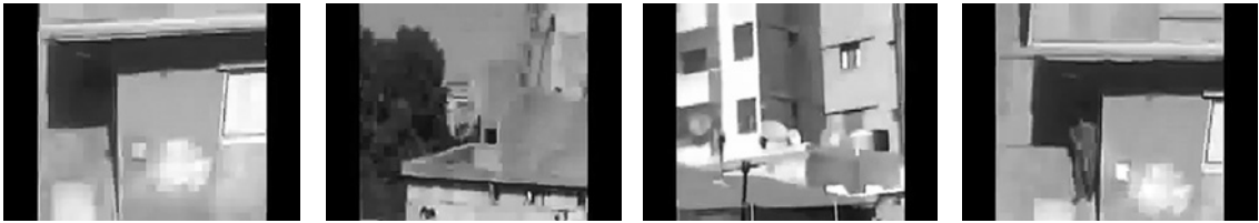
Abb. 1-7 Screenshots aus einem anonymen YouTube-Video, hochgeladen am 4.7.2011, gesehen am 10.4.2014 (Orig. in Farbe)

erkennen? Ist der Zeitpunkt des möglichen Todes im Bild eingeschrieben? Wie kann man sich diese Clips ansehen, und wie müssen sie präsentiert werden?