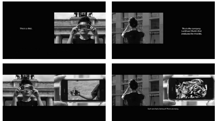
Abb. 8–11 Screenshots der Zweikanal-Videoinstallation Abstract von Hito Steyerl (Orig. in Farbe)

Der Raum vor der Leinwand sowie der, in dem sich die Projektion ereignet, ist der neue hors-cadre . (Abb. 8–11)