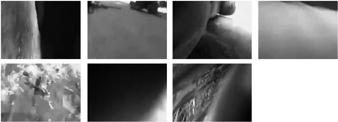
Abb. 12–18 Screenshots aus dem Film Abstrakter Film von Birgit Hein (D 2013, Orig. in Farbe)

libyschen Bürgerkrieg stammen. Ihr geht es dabei jedoch nicht um Bebilderung; die Ausschnitte, die sie ausgewählt hat, zeigen allesamt Aufnahmen, auf denen fast nichts zu erkennen ist, weil das Objektiv verdeckt, die Kamera heruntergefallen oder das Bild von Kompressionsartefakten übersät ist. Einzig der Ton, der zu den jeweiligen Ausschnitten gehört, lässt darauf schließen, dass es sich um Situationen des Kampfes handelt, da unentwegt Schüsse und Schreie zu hören sind. Hier ist es der Ton, der das Bild vervollständigt, Textinserts gibt es nicht. (Abb. 12–18)