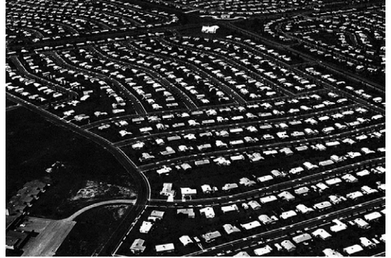
Abb. 3 Levittown, Pennsylvania, ca. 1960

ebenso einer Software ähneln. Im Unterschied zu den Objektformen von architektonischen Meisterwerken oder Masterplänen operieren diese aktiven Formen in einem anderen Modus oder Register und verhalten sich wie Codeschnipsel im Betriebssystem. Aktive Formen sind Dispositionsmarker, und Disposition ist die Beschaffenheit einer Organisation, die sich aus der Zirkulation dieser aktiven Formen innerhalb der Organisation ergibt. Da sich diese Formen unablässig verändern, verändert sich auch die Art und Weise der Disposition. Keine taucht als Grundbaustein oder Begriff in einem Glossar auf. Identifiziert man jedoch auch nur einige der zahlreichen aktiven Formen, die manipuliert, neu konzipiert oder neu geschrieben werden können, so beginnt man, in den Code einzudringen, so dass die Dispositionen, die durch sie verändert werden, greifbarer werden und das Know-how verfügbar wird, um die politische Beschaffenheit des infrastrukturellen Raums zu verändern. Und da es sich bei diesen Formen um Anzeichen laufender Prozesse handelt – die den Kräuselungen des Wassers entsprechen, die sich die Flussschifffahrt zunutze macht –, basiert ihre Praktikabilität gerade auf ihrer Unbestimmtheit. [...]