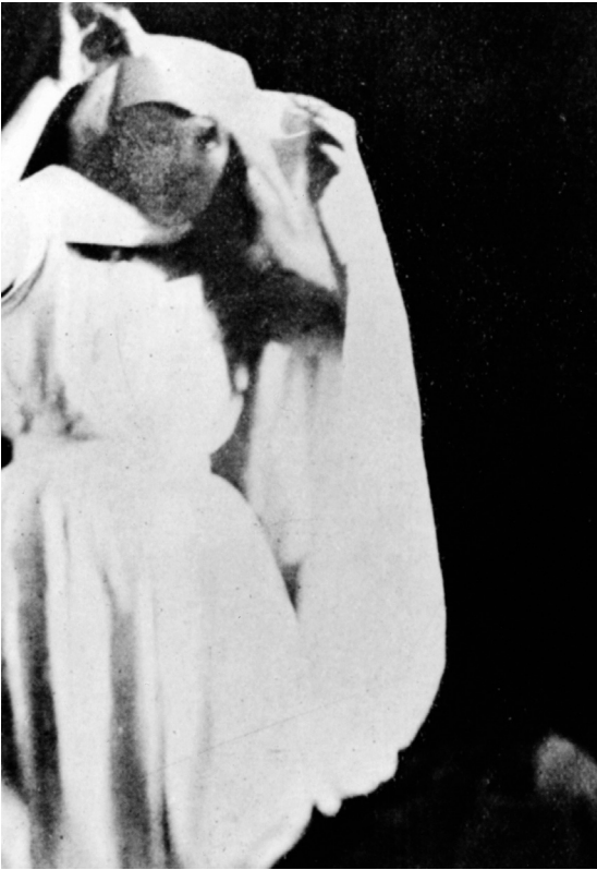
Elizabeth d'Esperance: «Yolande as she appeared when materialized», Fotografie 1890

schemenhafte Gestalten oder seltsame Hände aus den Faltungen eines Vorhangs (Nüchterne Beobachter erkennen die Tricks und sind, wie Nietzsche zum Beispiel, tief enttäuscht 21 ). Medien, die sich über Klopfcodes mit Geistern verständigen, wurden seit den Fox-Sisters von den 1840er Jahren an berühmt, und sie wurden perfekter darin zu verbergen, wie sie klopfen. Zu Ihnen gehörte auch Madame Blavatsky, Begründerin der Theosophischen Gesellschaft und gleich mehrfach überführte Betrügerin. Betrug und Suggestion, unglaubliche Leistungen der in Trance Verfallenen und eindeutige dreiste Betrüger – das ist die Mischung der Shows, die Hunderte von mediumistischen Medien der zweiten Jahrhunderthälfte bieten. 22