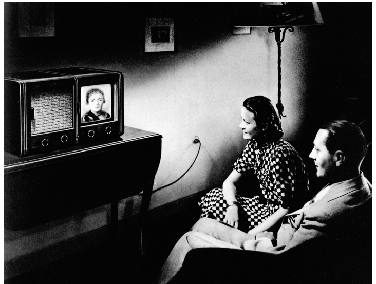
Fernsehen in den 1940er Jahren

Empiriker waren sehr bald mit diesen Erhebungen einverstanden. Denn Parazustände ließen sich in Fragebögen gut indizieren und empirisch messen. Beispiel: «My favoured actor in the show reminds me of myself.» Oder: «I enjoyed trying to predict what he would do.» Oder: «Ich würde den gern mal kennenlernen, ich mag seine Stimme.» 9 Fragekaskaden diesen Typs sind seit Jahrzehnten patentiert und gelten als Standardnachweis einer PSI-Kommunikation, wobei PSI hier für nichts Außerirdisches, sondern für Para-Soziale-Interaktion steht. Die Antworten erwiesen sich als statistisch konsistent, und das genügte den empirischen Medienforschern, die an der Untersuchung epistemologischer Tiefenstrukturen in der Regel kein Interesse haben.