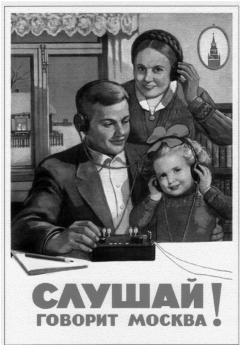
Abb. 3 V. Goworkow, «Slušaj gorovit Moskva!» («Hör zu, Moskau spricht!»), Plakat aus dem Jahr 1949