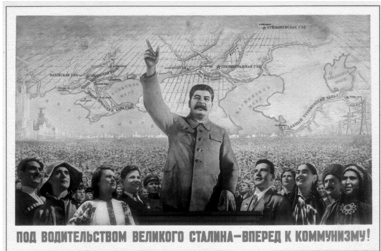
Abb. 4 M. Solov'ev, B. Berezovskij, «Pod voditel'stvom velikogo Stalina – vperëd k kommunizmu!» («Unter Lenkung des großen Stalin – auf zum Kommunismus»), Plakat aus dem Jahr 1951