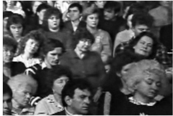
Abb. 6–8 Drei Standbilder aus der Sendung Kašpirovskij , Erster Kanal des sowjetischen Staatsfernsehens am 9. Oktober 1989

Zustand der Trance fortführen, an Stelle der Passivität des Einzelnen wirken. Die erste seiner sechs Sendungen fand am 9. Oktober 1989 statt. Während in Leipzig 70.000 Menschen demonstrieren, «Wir sind das Volk» rufen und mit dieser seit 1953 ersten von Massen getragenen Protestveranstaltung gegen das Regime der DDR aufmarschieren, sitzen Millionen von Zuschauern im Land der Perestrojka zur Primetime vor dem Fernseher und lassen sich von einem Wunderheiler auf die bevorstehenden Veränderungen einstellen: