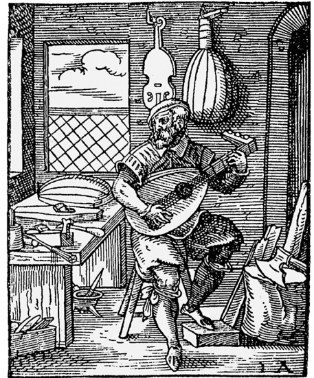
Abb. 1 Der Lautenmacher von Jost Amman, Holzschnitt, 1568

Abgesehen von diesen Einwänden kann ich zustimmen, dass der Unterschied zwischen den beiden Sichtweisen auf das Cello genau darin besteht: dass in der ersten Perspektive die Lebendigkeit der Materialien, die es zusammensetzen, nicht wirklich ins Bild gerät, während sie im zweiten Bild die Überhand gewinnt. Die Materialien überwältigen sozusagen das Ding. Der Vorteil dieser zweiten Perspektive besteht darin, dass sie uns erlaubt, Fragen über die Eigenschaften der Materialien zu stellen (anstatt über die Materialität der Dinge). Und dies öffnet, wie Sie sagen, den Weg zu einer Ökologie der Materialien.