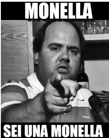
Abb. 1 Erster Schritt des enfreakments : Eine ausgewählte Eigenschaft wird zur Synekdoche für die gesamte Person: Ein Internet-Mem mit Giuseppe Simone (einem der bekanntesten Trash Stars) und seinem bekanntesten Spruch («Du bist eine Pennerin!»)