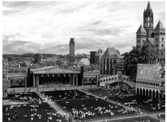
Abb. 2 Der Vrijthof-Platz kurz vor Konzertbeginn der Love in Venice -Konzertreihe 2014: Bühne, seitliche Bildschirme und venezianische Kulisse

Meine Forschung über André Rieu umfasst Feldstudien bei den sogenannten Vrijthof Concerts 2013 und 2014 in Maastricht (die Hauptstadt der niederländischen Provinz Limburg, Rieus Geburtsstadt) sowie Analysen von DVDs, YouTube-Videos, Rieus eigenen Aufzeichnungen, Real-Life-Serien über seine Touren, Making-ofs, Special Features, Nachrichtenausschnitten, Fansseiten und anderen Medien, sämtliche Gelegenheiten, bei denen «André Rieu» das Thema ist.