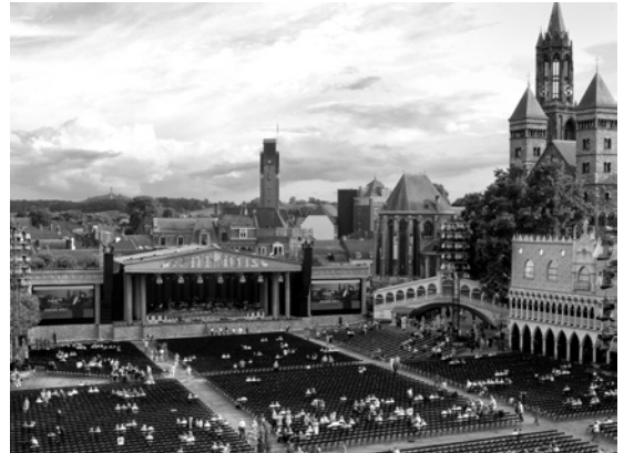
Abb. 2 Der Vrijthof-Platz kurz vor Konzertbeginn der Love in Venice -Konzertreihe 2014: Bühne, seitliche Bildschirme und venezianische Kulisse

Meine Forschung über André Rieu umfasst Feldstudien bei den sogenannten Vrijthof Concerts 2013 und 2014 in Maastricht (die Hauptstadt der niederländischen Provinz Limburg, Rieus Geburtsstadt) sowie Analysen von DVDs, YouTube-Videos, Rieus eigenen Aufzeichnungen, Real-Life-Serien über seine Touren, Making-ofs, Special Features, Nachrichtenausschnitten, Fansseiten und anderen Medien, sämtliche Gelegenheiten, bei denen «André Rieu» das Thema ist.