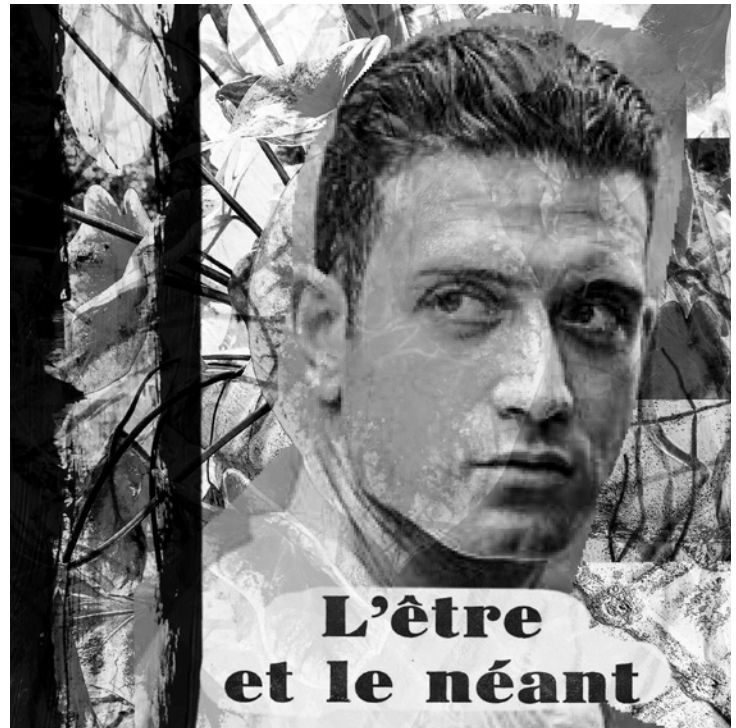
Abb. 2 Omar Sharif Jr. In Being and Nothingness , Wayne Koestenbaum, 2016

Ein anderer meiner Instagram-Posts kann nun als Coda unseres Gesprächs über Celebrity-Kultur dienen: Für diesen Post habe ich aus dem Internet ein Foto von Omar Sharif Jr. heruntergeladen, einem offen schwulen Star, der zufällig der Sohn eines noch berühmteren Vaters ist, Omar Sharif. In meiner Collage habe ich dieses Foto von Sharifs filis mit der Formulierung Being and Nothingness zusammengestellt, dem Ausschnitt aus einem heruntergeladenen Foto von der Titelseite der englischen Übersetzung von Sartres Band. Ein Hashtag für meinen Post war #remakes. Ein anderer war #beingandnothingness. Ein anderer war #omarsharifjr. Die Überschrift meines Posts: «Omar Sharif Jr. in Being and Nothingness ». Ein paar Tage, nachdem ich dieses fiktive Filmstill eines imaginären Remakes eines Buches – Das Sein und das Nichts , das niemals nachvollziehbar die Grundlage eines Films abgeben könnte gepostet hatte, habe ich erfreut festgestellt, dass Omar Sharif Jr. das selbst mein Post <geliket> hat. Omar Sharif Jr. hat einen Instagram-Account; wer auch immer dafür zuständig ist, <mochte> bzw. <likete> meinen Post. Hat Omar selbst meine Collage gesehen? Hat Omar sie gewürdigt? Oder hat jemand, der für Omar arbeitet – der den Star vertritt – den Post gesehen? Ist