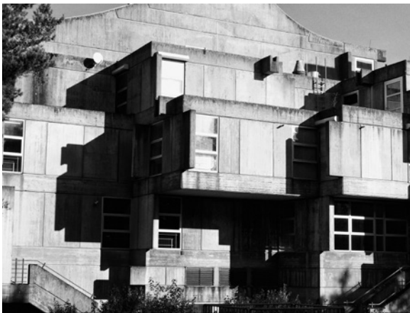
Abb. 1 Arne Schmitt: Marburg – Chemie Campus, aus der Serie: Wenn Gesinnung Form wird , 2012

Im Bauwelt -Gespräch sind sich die Teilnehmer einig, dass auch in Bochum eine weitaus wegweisendere Architektur in Realisation begriffen sei als die, die von Bremen je zu erwarten wäre. Für das Projekt einer Universitätsmaschine, das Le Corbusiers Idee der Wohnmaschine weiterdenkt, ist die Ruhr-Universität Bochum, die einem Satelliten gleich über dem Ruhrtal schwebt und nur über eine Autobahnbrücke und eine Tiefgarage erreichbar ist, das beste Beispiel.