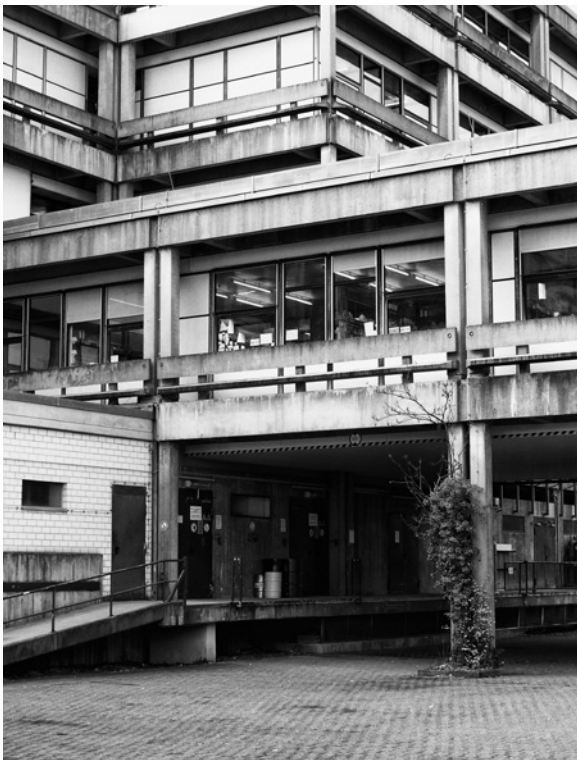
Abb. 2-3 Arne Schmitt: Marburg – Hörsaalgebäude, aus der Serie: Wenn Gesinnung Form wird , 2012

1967, im selben Jahr, als in Bremen eine Universität gegründet wurde, in Bochum ein Torso von Universität stand, in Berlin der Bau der Rostlaube begann und in Marburg die Bebauung der Lahnberge, als sich im Bauwelt -