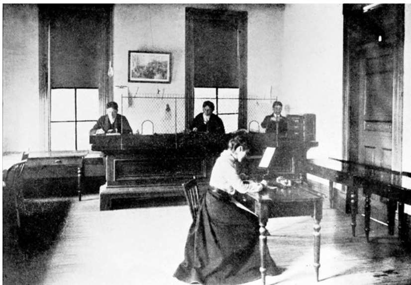
Abb. 1 Mitarbeiter telegrafieren Nachrichten in einem Büro der Detroit News, 1918