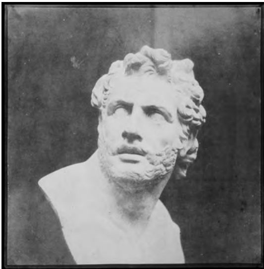
Abb. 4a William Henry Fox Talbot, Bust of Patroclus , um 1844, Salzpapierabzug von einer Kalotypie, 17,7 × 17,7 cm (Bild), 18,2 × 18,0 cm (Papier)