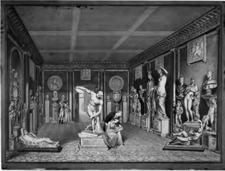
Abb. 5 W. Chambers, The Townley Collection in the Dining Room at Park Street, Westminster , um 1794, Gouache, Bleistift und Tusche (Original in Farbe), 39×53 cm