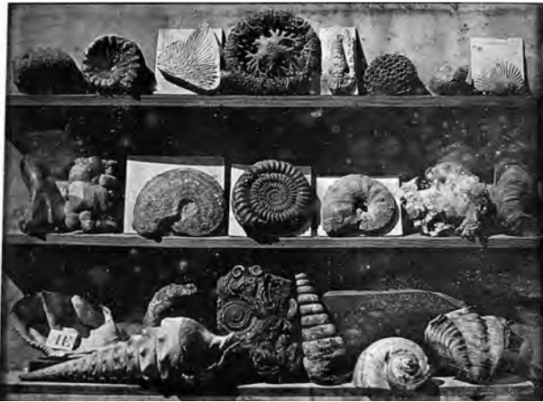
Abb. 3a Louis Jacques Mandé Daguerre, Coquillages , um 1839, Daguerrotypie, 16,3 × 21,2 cm (Platte), 22 × 27 cm (Bilderrahmen)