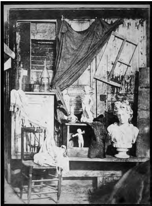
Abb. 2a Hippolyte Bayard, o. T. [Bayards Atelier], um 1845, Salzpapierabzug von einem Papiernegativ, 23,5 × 17,4 cm