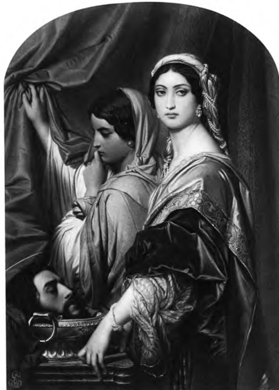
Abb. 6 Robert Jefferson Bingham, Hérodiade avec la tête de saint Jean-Baptiste , 1858, Reproduktion eines Gemäldes von Paul Delaroche (1843)