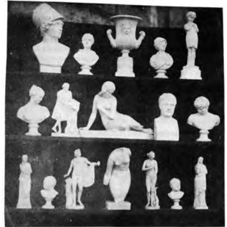
Abb. 3b William Henry Fox Talbot, Figurines on three shelves , in the courtyard of Lacock Abbey, um 1841, Salzpapierabzug von einer Kalotypie, 15 × 14,6 cm