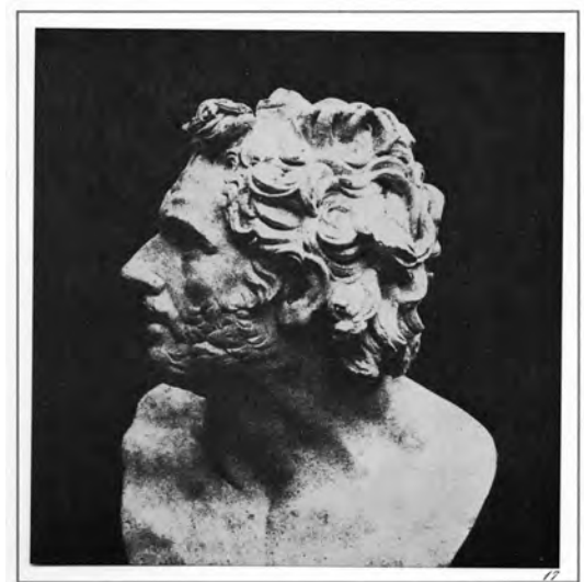
Abb. 4b William Henry Fox Talbot, Bust of Patroclus , 9.8.1843, Salzpapierabzug von einem Papiernegativ, 14,9 × 14,5 cm