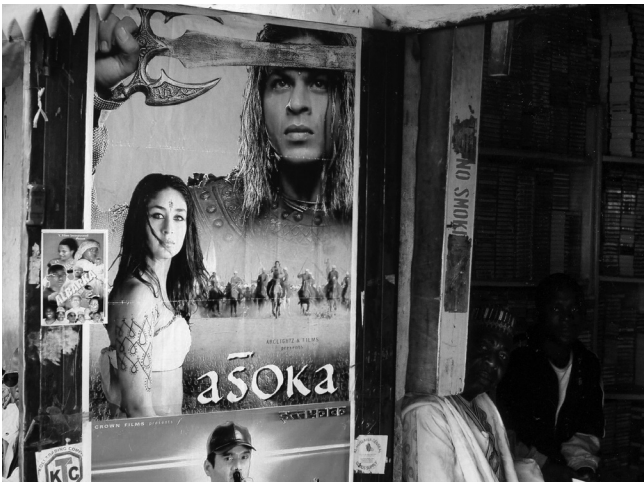
Abb. 6 Indische und Hausa-Film-poster vor einem Videogeschäft