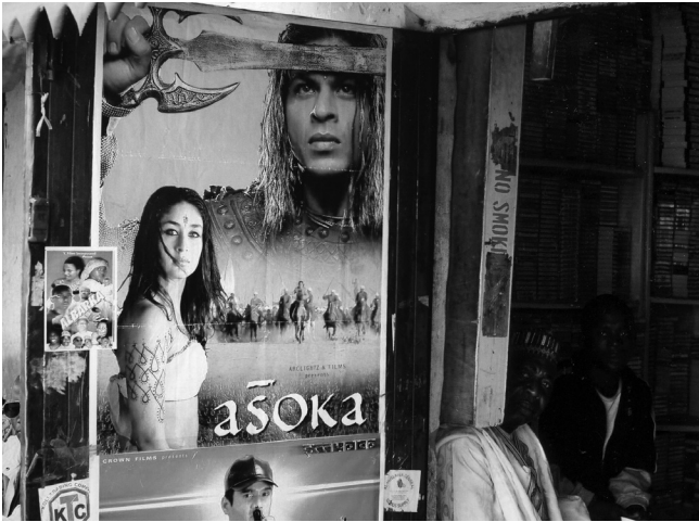
Abb. 6 Indische und Hausa-Film-poster vor einem Videogeschäft