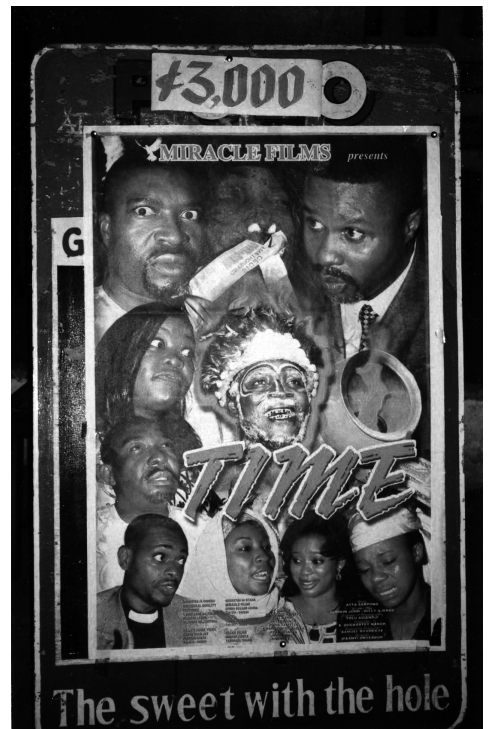
Abb. 5 Poster des Films Time , ghanaisch-nigerianische Koproduktion

Der Aufstieg eines privatisierten Medienphänomens steht nicht nur stellvertretend für eine Aushöhlung staatlicher Macht, sondern vielmehr für eine größere Bewegung, innerhalb derer die Schattenwirtschaft den Staat selbst rekonfiguriert hat. Nach Angaben des US-amerikanischen Außenministeriums stellt Nigeria den größten Markt für Produktpiraterie in Afrika, einer Schätzung zufolge leiten sich bis zu siebzig Prozent des derzeitigen Bruttoinlandsprodukts Nigerias aus der Schattenwirtschaft her, was diese, prozentual betrachtet, zu einer der größten Ökonomien dieser Art in der Welt macht, mit der nur noch Thailand gleichzuziehen vermag. 16 Statistische Angaben wie diese sind stets provisorische und haben – wie viele andere Nigeria betreffenden Statistiken – den Charakter eines Simulakrums, geben sie einem doch weniger den numerischen Ausdruck eines tatsächlichen Istzustands, sondern eher eine Nachahmung rationalistischer Darstellungen des Wirtschaftslebens. Doch ist die Zweitökonomie in Nigeria derart gewachsen, dass bei deren Darstellung keiner mehr nachkommt. Niemand weiß wirklich, wie hoch das Bruttoinlandsprodukt ist, niemand vermag die Zahlungsbilanzen, geschweige denn die genaue Größe der Bevölkerung zu berechnen. 17 Starke Kräfte sind am Werk, um sicher zu stellen,