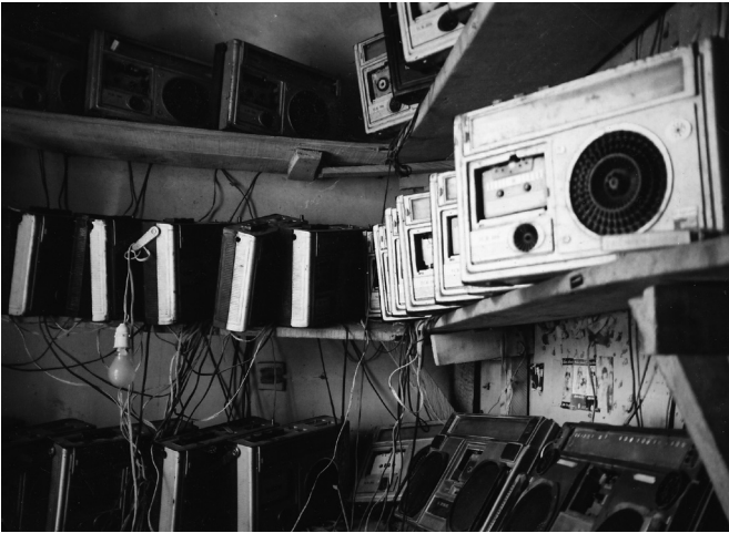
Abb. 7 Kassettenspieler, zum Überspielen verkabelt

Urbanismuskritische Untersuchungen haben festgestellt, wie sehr die utopischen Theorien der Technologie und des urbanen Wandels die Tatsache herunterspielen, dass ganze Gesellschaften von der Teilnahme an den neuen informationstechnischen Infrastrukturen ausgeschlossen sind (ein Zustand, den Manuel Castells als «technologische Apartheid» bezeichnet hat; 25 Einige dieser Argumente finden sich auch im Rahmen der Debatte über die sogenannte «digitale Kluft» ( digital divide ) und die Aufteilung der Welt in technologisch Besitzende und Besitzlose wieder. Mein Problem mit