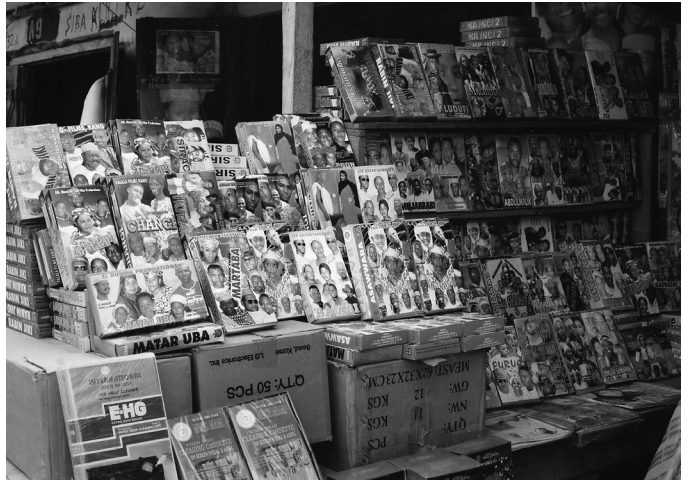
Abb. 4 Hausa-Videos, Auslage

Wambai. Vor dort aus verkaufen sie dann an Händler in anderen Städten des Nordens, die kleinere städtische und auch ländliche Händler mit Nachschub versorgen, welche wiederum an wandernde Tagelöhner verkaufen. Das System gründet sich auf ein komplexes Gleichgewicht von Kredit und Vertrauen; und obwohl es teilweise auf Piraterie angewiesen ist, hat es sich zu einem hoch organisierten, weit ausgedehnten Distributionssystem für Audio- und Videokassetten gemausert. Der Erfolg der neuen Distributionsform ist der Regierung nicht entgangen, die zwar offiziell