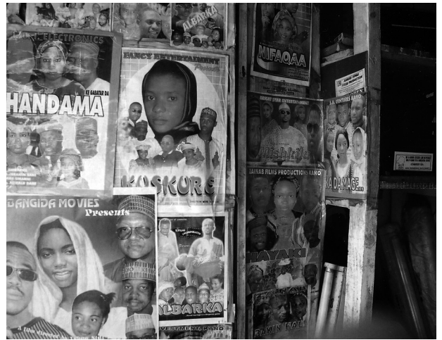
Abb. 8 Videoposter

Wer in Nigeria Handel mit legal oder illegal reproduzierten Medien treibt, zeichnet die Daten auf billigen Kassetten und mit Aufnahmegeräten minderer Qualität auf. Gewonnen werden diese Informationen meistens mithilfe alter Videorekorder, Fernsehgeräte und Kassettenabspielgeräte, die stets Verzerrungen und Störungen hinzufügen. Wenn man sich etwa in Nigeria, wo es keinen offiziellen Vertrieb für nicht raubkopierte Medien gibt, einen Hollywood-Film oder einen indischen Film auf Video anschaut, dann kann man sicher sein, dass man die Kopie einer Kopie einer Kopie zu sehen bekommt. Da dieselben Händler mit derselben Ausrüstung und denselben Leerkassetten auch Hausa-Videos vervielfältigen, bleibt im Endeffekt der visuelle Qualitätsstandard stabil. Raubkopierte Bilder haben eine halluzinogene Wirkung. Alle Details gehen verloren, und so löst sich auch die realistische Darstellung im pulsierenden Lichtschein auf. Charakteristische Gesichtszüge werden ausgewaschen, Farben