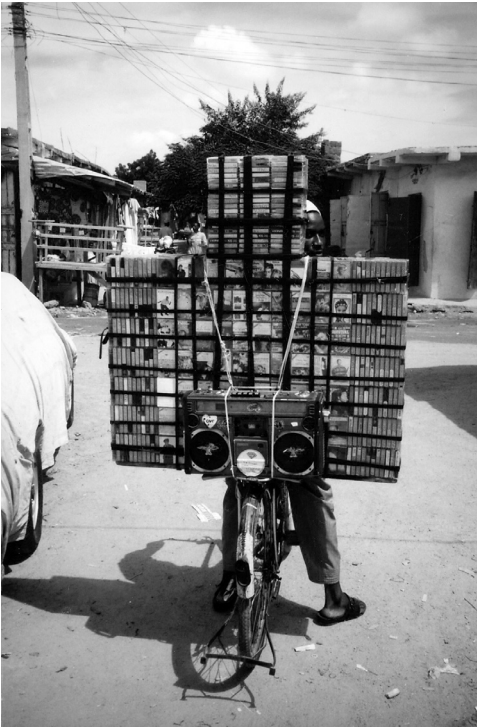
Abb. 9 Kassettenverkäufer, Kano

26 Christopher Waterman, Jùjú: A Social History and Ethnography of an African Popular Music , Chicago (Chicago University Press) 1990.