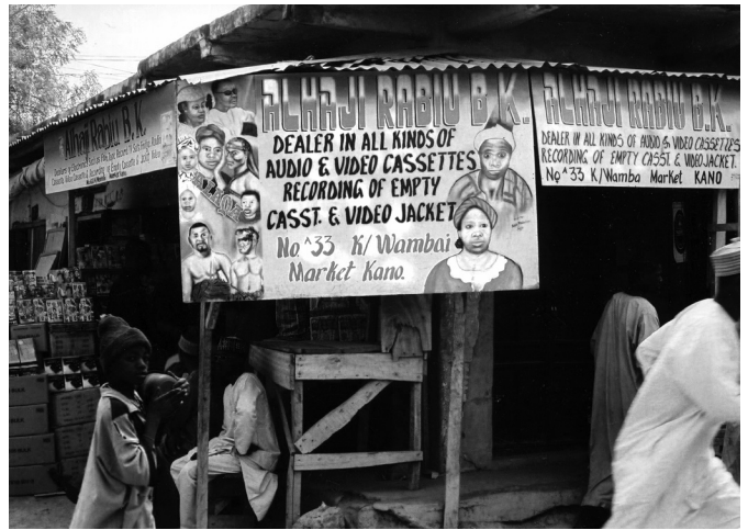
Abb. 2 Kofar Wambai Market, Kano

Als Beispiel eignet sich hier der Markt Kofar Wambai in Kano. Kofar Wambai ist am bekanntesten für das dort verkaufte Garn, das bei den kunstvollen Stickereien auf den langen Gewändern der Hausa, den babban riga , Verwendung findet. Ganze Abteilungen des Markts erstrahlen in den leuchtenden Farben des Garns, das von den Eingängen der Verkaufsstände hinunterhängt, doch gibt es