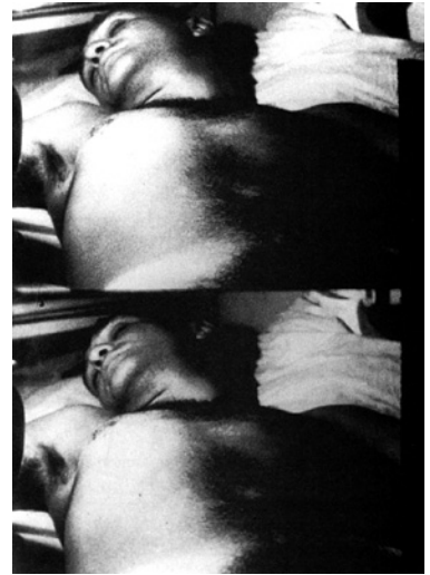
Abb. 2 Stills aus Sleep , Andy Warhol, USA 1964

Die das Ausgangsmaterial variierende und segmentierende Wiederholung ist wiederum zur Entstehungszeit von Andy Warhols Sleep bereits in die serielle Logik des Fernsehens fest integriert, sei es in Form eines immer wieder zu unterschiedlichen Zeiten bzw. verschieden lange auftauchenden Sendelogos, sei es in Form der Wiederverwertung desselben Filmmaterials über mehrere Episoden und Staffeln einer Fernsehserie hinweg, etwa für einen establishing shot . Oder man denke an die Fernsehberichterstattung über das Attentat auf John F. Kennedy im September 1963. 19 Ganz ähnlich wie beim Umgang mit den Livebildern von den Flugzeugen, die am 11. September 2001 in das New Yorker World Trade Center geflogen sind, wurden auch hier schon die kurzen Filmaufnahmen vom Attentat auf Kennedy permanent im Fernsehen gesendet, in allen möglichen Sendungen aufgegriffen, in unterschiedlich langen Sequenzen wiederholt, verlangsamt oder angehalten, mit Zwischenschnitten versehen usf. Gerade an diesem Beispiel zeigt sich deutlich, dass die Form der Wiederholung, in der das Ausgangsmaterial unterschiedlich segmentiert bzw. bearbeitet wiederkehrt, ein zentrales Ordnungsprinzip televisueller Programm- und Bildgestaltung ist – gerade auch im Umgang mit außergewöhnlichen Ereignissen, die im Gegensatz stehen zu stetig wiederkehrenden seriellen Phänomenen wie Weihnachten oder Daily Soap.