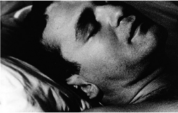
Abb. 3 Still aus Sleep , Andy Warhol, USA 1964