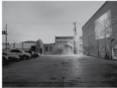
Abb. 2: MobMov in Berkeley, Kalifornien