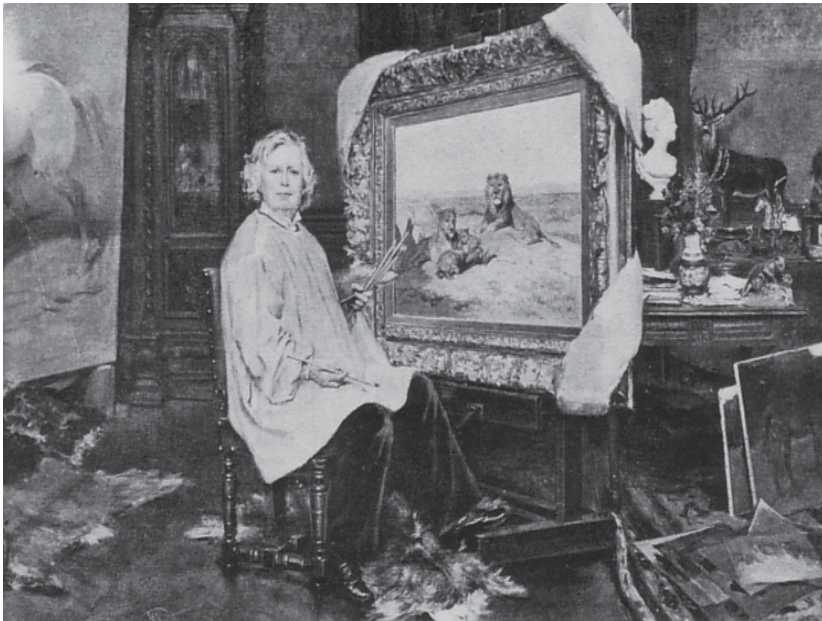
Abb.4: Die Köning der Löwen: Rosa Bonheur im Atelier.

Die naturschützerisch-bewahrende Zeitlichkeit ist eine diskursive Formation des 19. Jahrhunderts. Darstellungen von Tieren in naturwissenschaftlichen Werken dienen in erster Linie dem Erfassen und Inventarisieren beobachtbarer Tierarten. Darstellungen von Tieren in der Kunst, insbesondere aber in der populären Malerei von Künstlern wie Edwin Landseer und Rosa Bonheur, deren Werke in der zweiten Hälfte des 19. Jahrhunderts als Drucke in großen Auflagen zu erschwinglichen Preisen zirkulierten und manches Wohnzimmer schmückten, 4 zielen primär auf bestimmte affektive Reaktionen ab (Mitgefühl mit dem sterbenden Hirsch, Rührung über spielende Hunde, erhabener Schrecken im Angesicht kämpfender Bären etc.). Die beiden Register der Tierdarstellung, das wissenschaftlich-inventarisierende und das populär-affektive, überlagern