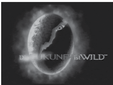
Abb. 1 u. 2 (gegenüberl. Seite): Der Tierfilm als Derivat des Blockbusters: Key Art-Symbole für DIE ZUKUNFT IST WILD (GB/D/F/J/USA 2002) und ALIEN (USA 1979).

Wörtern oder weniger zusammenfassen lässt und das die Vermarktungstechniken des Hollywood-Blockbusters nachahmt, insofern das Konzept an der Benutzeroberfläche des Films (in sei-