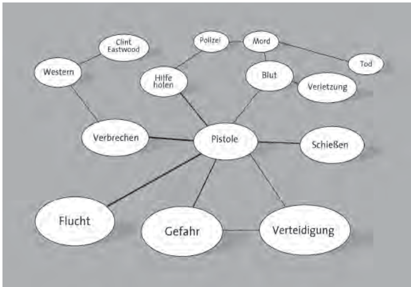
Abb. 3: Beispiel für semantisches Netzwerk

Solche Phänomene werden als Priming bezeichnet. ◀15 Priming-Theorien gehen davon aus, dass Wissen im Gedächtnis in Netzwerken miteinander verbunden ist. ◀16 Abbildung 2 zeigt Ausschnitte eines (hypothetischen) semantischen Netzwerkes, in dessen Zentrum das Konzept »Pistole« steht (vgl. Anderson et al. 1998). Wird ein Knoten in einem solchen Wissensnetzwerk aktiviert und ins Bewusstsein geholt, dann kommt es (gemäß der cognitive neoassociation theory ) von diesem Knoten aus zu einer ausbreitenden Aktivierung ( spreading activity ) benachbarter Knoten bzw. Wissens Elemente: