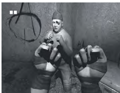
Abb. 2: Screenshot aus THE CHRONICALS OF RIDDIC: ESCAPE FROM BUTCHER BAY.

Eine Erhöhung der Zugänglichkeit von Wissenselementen kann aber auch erfolgen, ohne dass diese Elemente direkt aufgerufen und zu Bewusstsein gebracht werden. Es kann ausreichen, dass Wissenselemente bewusst gemacht werden, die mit diesen Elementen lediglich in einem inhaltlichen oder assoziativen Zusammenhang stehen. Dieser Vorgang lässt sich leicht beobachten, wenn man eine Person bittet, folgende Fragen möglichst schnell zu beantworten: Welche Farbe hat der Schnee? Welche Farbe hat das Bettlaken im Hotel? Welche Farbe hat Kalk? Was trinkt die Kuh? Viele Personen antworten dann auf die letzte Frage mit »Milch« statt »Wasser«, geben also spontan (automatisiert) eine falsche Antwort.