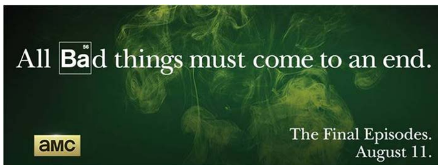
Abb. 1: Werbung des Kabelsenders amc für die letzte (Halb-)Staffel von Breaking Bad

Folgen kalkulierbar wird: „All bad things must come to an end“, bewirbt amc die letzten acht Folgen (siehe Abb. 1). Damit wird zwar der character arc zu einem konsequenten, moralischen Abschluss gebracht, 40 doch die unheimliche Zeit des ‚Ausstands‘, die zuvor die Serienzeit von Breaking Bad regierte, wird äußerst bieder zu Ende gebracht. 41