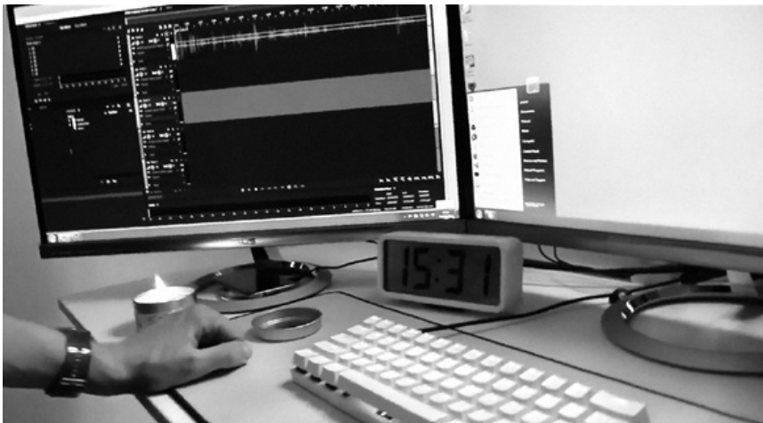
PewDiePie in seinem Studio-Setup (2016)